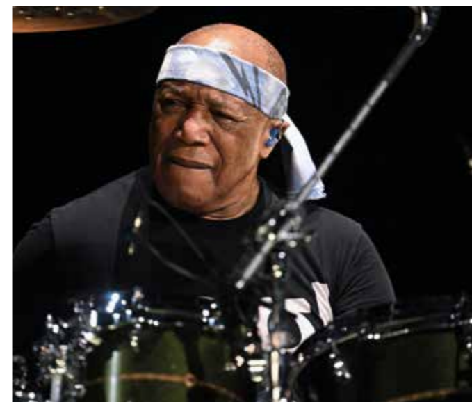
Billy Cobham 2023

schuldig; hoezo? Ik ben gewoon een beetje in de studio bezig, niet veel bijzonders. "Je album staat op 32 in de Billboard-lijst en krijgt overall fantastische recensies", was het antwoord. Dat was helemaal langs me heen gegaan, want ik volgde dat soort dingen toen helemaal niet. Maar ik moest dus snel een band bij elkaar zoeken en Spectrum live gaan brengen."