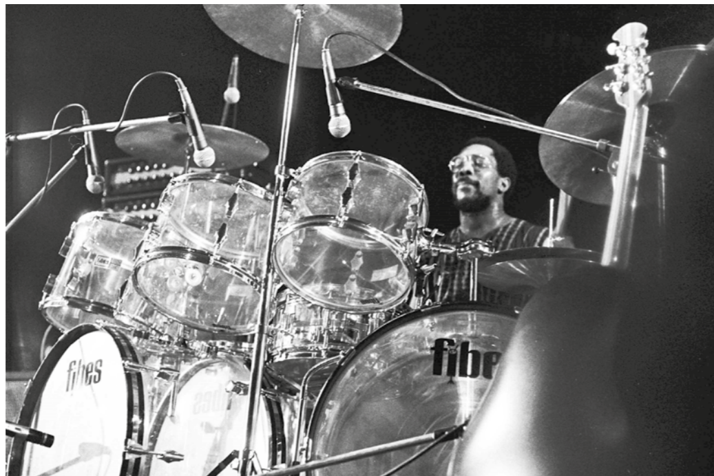
Billy Cobham in Amsterdam, 1973

Leland Sklar verklaart in zijn YouTube-video over de track