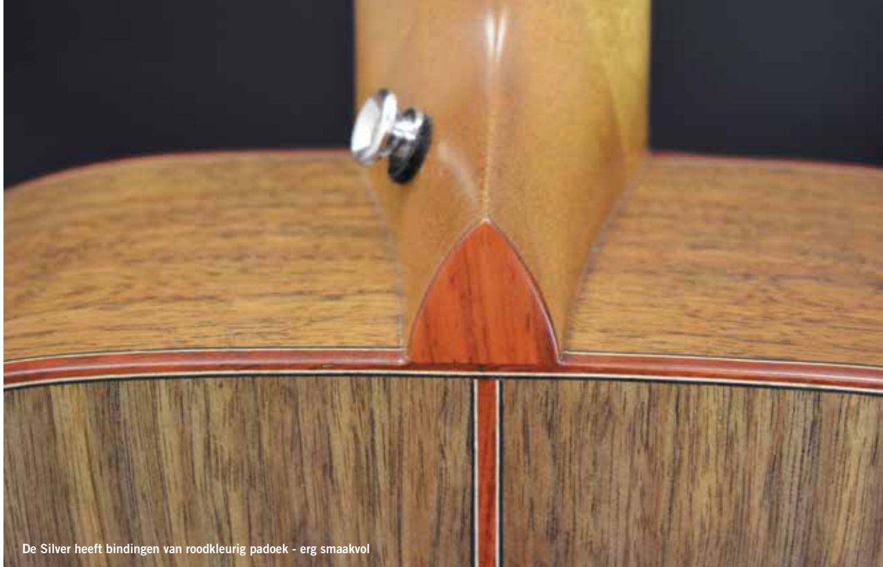
De Silver heeft bindingen van roodkleurig padoek - erg smaakvol

» esdoorn, lauro preto, kingwood en kersen.