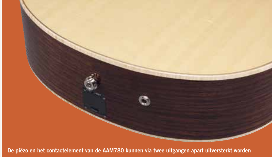
De piëzo en het contactelement van de AAM780 kunnen via twee uitgangen apart uitversterkt worden

De gitaar ziet er ondanks de iets afwijkende vorm klassiek uit met zijn massief sparren bovenblad en massief palissander zij- en achterkant. Ook hier weer de A.I.R. poort en de smal toelopende kop. De toets van de 780e is van ebben, zonder binding. Visueel dus een heel ander instrument dan de AAM370, ondanks de gemeenschappelijke bodyvorm.