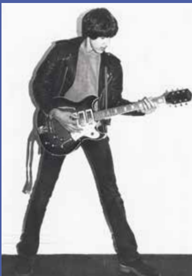
Een jonge Anne Soldaat met zijn Frima, met daarnaast zijn 'nieuwe' exemplaar

“Door toeval heb ik mijn eerste gitaar ooit herontdekt. Een Frima, een submerk van Egmond. Iemand kocht zo'n gitaar, hij is online gaan zoeken en vind een foto van mij met mijn Frima. Hij zocht contact en ik vond dat bijzonder, want ik had nog nooit een tweede gezien. Toevallig bleek die jongen vlakbij mij te wonen, hij is langs geweest en ik heb de gitaar, die helemaal door hem was opgeknapt, gekocht. Hij heeft ook mijn Frima onder handen genomen, maar die van hem speelt lekkerder en die heb ik veel gebruikt op het album. Door toeval speel ik dus weer op mijn allereerste gitaar. Het is qua materiaal en bouwwijze geen supergitaar, maar ik ben verbaasd wat een supergoed geluid hij heeft. Hij klinkt fantastisch op mijn Pro Reverb en de moraal is dan ook dat een versterker nooit zonder meer goed of slecht is. Je moet de juiste gitaar bij de versterker vinden.”