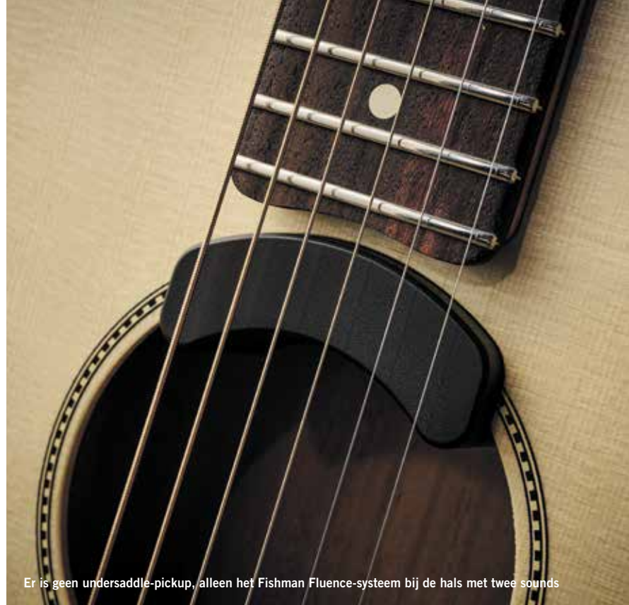
Er is geen undersaddle-pickup, alleen het Fishman Fluence-systeem bij de hals met twee sounds

Dat dus allemaal met een 'verkeerde' versterker. Hoe zou het gaan met de beste combo voor akoestische gitaren van dit moment, de AER Compact 60? Nou, wat denk je zelf? Het verschil was immens. Dit keer zorgden de grotere afmetingen en het mahonie