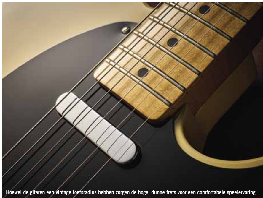
Hoewel de gitaren een vintage toetsradius hebben zorgen de hoge, dunne frets voor een comfortabele spelervaring

GITARIST ZEGT: Een mooi voorbeeld van een Telecaster/Nocaster uit begin jaren vijftig, met krachtige sounds en een aantrekkelijk prijskaartje; de dikke hals is niet voor iedereen