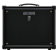
BOSS KATANA-50 MKII EX 1X12 COMBO

Met deze nieuwe Katana zet Boss de succesvolle serie versterkers voort. tekst Nick Guppy