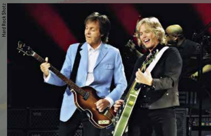
Hard Rock Shatz

In de periode na de sessies verdween de '61 en werd waarschijnlijk gestolen. Het probleem was dat niemand precies wist waar de bas was en wat er mee gebeurd is. Er zijn allerlei theorieën en beweringen, maar de bas is nog steeds niet boven water. Er zijn twee mogelijkheden. Of de bas werd bewaard in de vaste opslagplaats van de band in Abbey Road en werd daar gestolen of de bas werd meegenomen uit de kelder van Apple. Ik heb veel contact gehad met een persoon die daar in de vroege jaren zeventig werkte en hij meldt dat er zeker Beatles-spullen in de kelder lagen. Het was bij Apple nogal chaotisch en er liepen elke dag veel mensen in en uit. Hij vertelde dat het vaak 24/7 feest was en dat er zeker een Harrison-gitaar is gestolen uit de kelder. Dat kan het lot van de '61 zijn geweest.