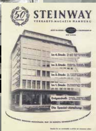
Steinway & Sons

In de periode na de sessies verdween de '61 en werd waarschijnlijk gestolen. Het probleem was dat niemand precies wist waar de bas was en wat er mee gebeurd is. Er zijn allerlei theorieën en beweringen, maar de bas is nog steeds niet boven water. Er zijn twee mogelijkheden. Of de bas werd bewaard in de vaste opslagplaats van de band in Abbey Road en werd daar gestolen of de bas werd meegenomen uit de kelder van Apple. Ik heb veel contact gehad met een persoon die daar in de vroege jaren zeventig werkte en hij meldt dat er zeker Beatles-spullen in de kelder lagen. Het was bij Apple nogal chaotisch en er liepen elke dag veel mensen in en uit. Hij vertelde dat het vaak 24/7 feest was en dat er zeker een Harrison-gitaar is gestolen uit de kelder. Dat kan het lot van de '61 zijn geweest.