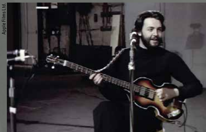
Apple Films Ltd.