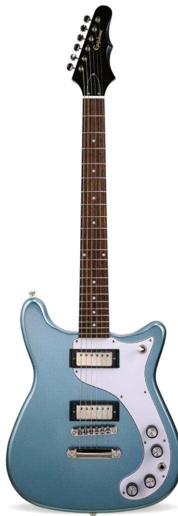
EPIPHONE 150TH ANNIVERSARY WILSHIRE

» GITARIST ZEGT: Fraaie gitaar die opvalt; ziet er veel duurder uit, veelzijdig en klinkt goed, met een muzikaal vibratosysteem. Toets kan een drupje olie gebruiken