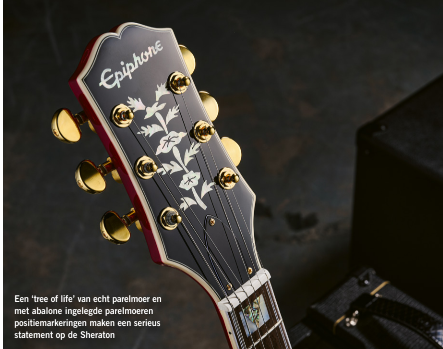
Een 'tree of life' van echt parelmoer en met abalone ingelegde parelmoeren positiemarkeringen maken een serieus statement op de Sheraton

Het is een geweldige gitaar voor fingerstyle-akkoordenwerk, jazzy begeleiding en solo's, en nog veel meer. Met zijn ruimte cutaway zijn ook de hoogste van de 20 frets goed bespeelbaar, hoewel je op een gitaar als deze natuurlijk minder in de allerhoogste posities komt. Natuurlijk, het is een jazzbak. Toch is dit instrument ook op zijn plaats in een jazzbluescombo dat Etta James- of Nat King Cole-nummers doet. De gitaar heeft een luxe, klassieke uitstraling en voelt uitermate authentiek.