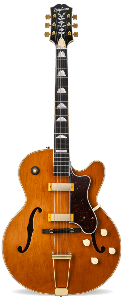
EPIPHONE 150TH ANNIVERSARY ZEPHYR DELUXE REGENT