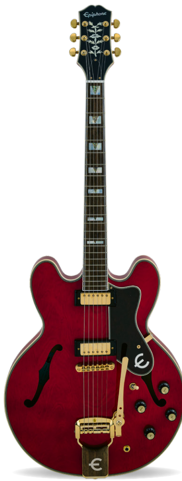
EPIPHONE 150TH ANNIVERSARY SHERATON

» GITARIST ZEGT: Wat een geweldige gitaar voor dit geld! Indrukwekkend uiterlijk, heerlijk bespeelbaar en qua klank veel veelzijdiger dan je zou denken. Werkelijk niets op aan te merken