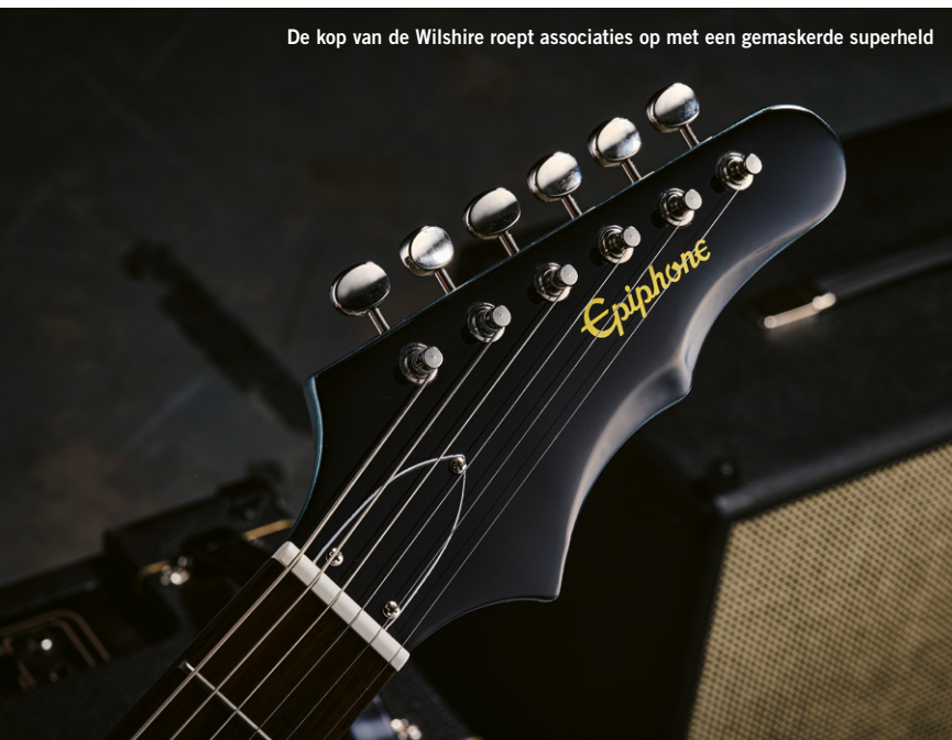
De kop van de Wilshire roept associaties op met een gemaskerde superheld

zijn onderscheidend en bruikbaar. Stel dat je je Tele vergeten bent, je SG of zelfs je Gretsch; geen probleem, deze Wilshire komt een eind in de buurt van alle drie. Toch heeft hij een eigen geluid dat je moet horen om het te snappen - denk aan Johnny Winter op zijn Firebird, dan heb je tenminste een idee.