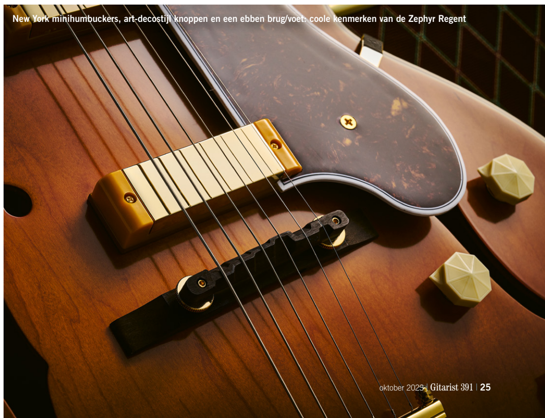
New York minihumbuckers, art-decostijl knoppen en een ebben brug/voet: coole kenmerken van de Zephyr Regent

Schakel over naar het brucelement en berg je maar want dit gaat