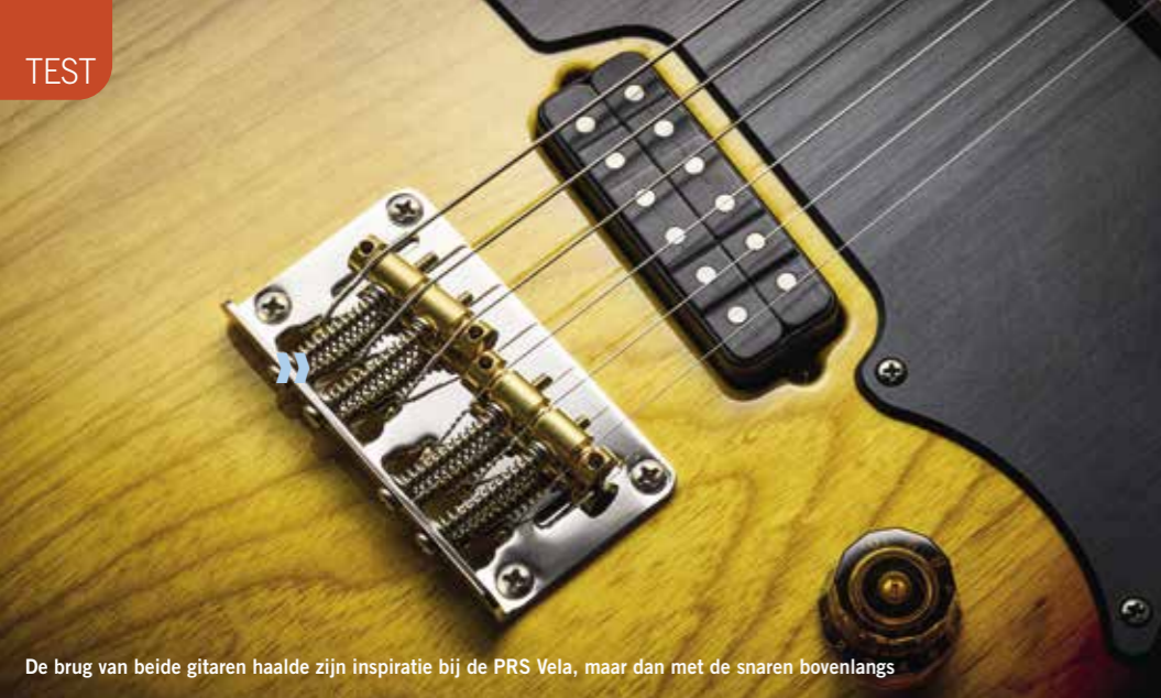
De brug van beide gitaren haalde zijn inspiratie bij de PRS Vela, maar dan met de snaren bovenlangs