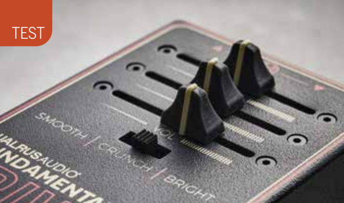
Elk pedaal heeft drie geluidsvarianties, te kiezen met een kleine schuifschakelaar

» Si maken beide gebruik van silicium-clipping, maar omdat de eerste het hoog filtert, klinkt die een stuk voller. Ook is er nog een set hard-clipping leds, iets luider en met wat smaakvolle compressie.