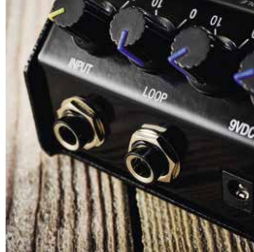
Met een Y-kabel kun je via een trs-jack een effect op de Guv'nor aansluiten, zoals een delay

Volgend in het voetspoor van de JCM900 versterkers blonk het oorspronkelijke Shredmaster pedaal uit in de krachtige high-gain sounds die in de smaak vielen van