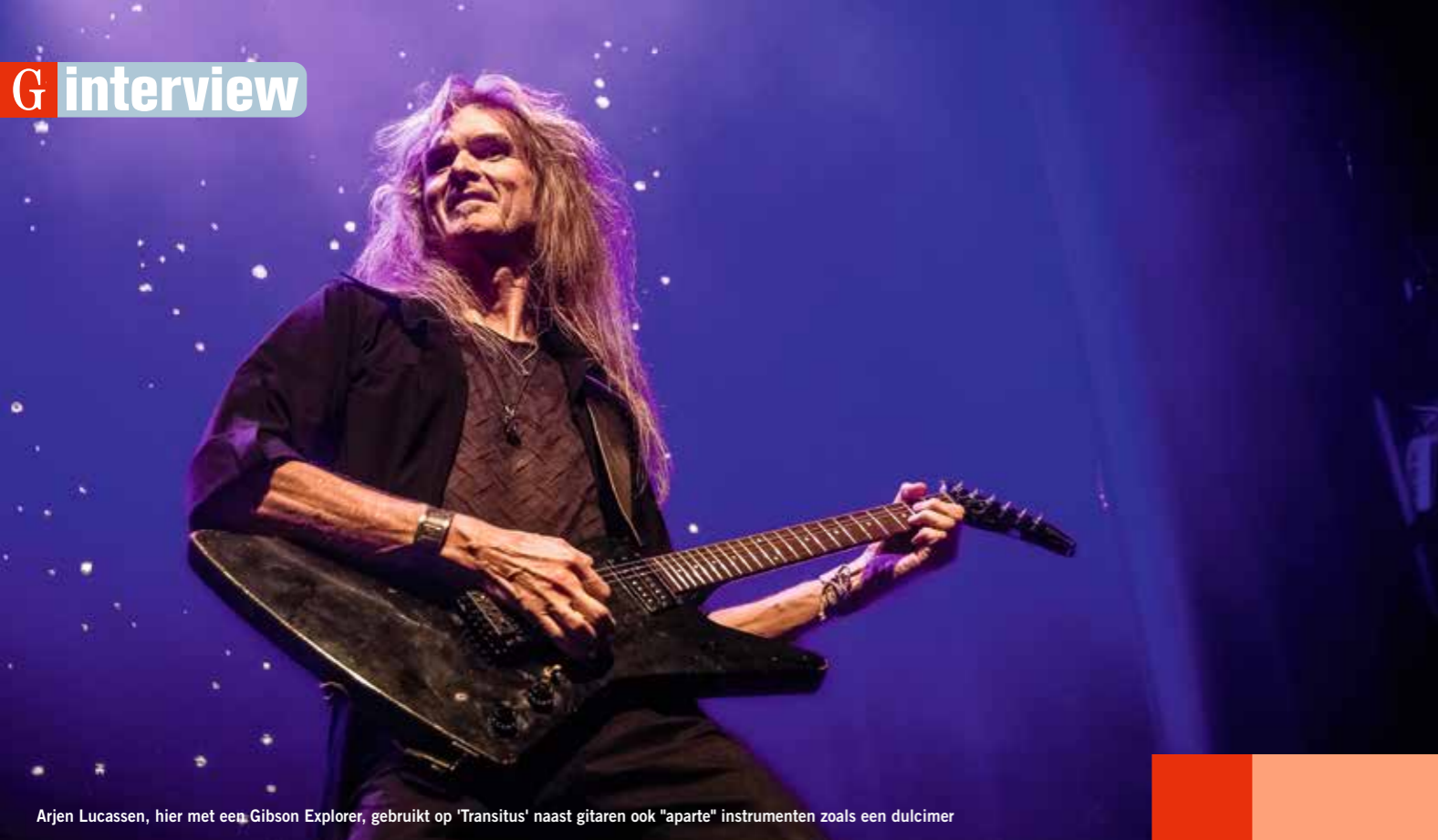
Arjen Lucassen, hier met een Gibson Explorer, gebruikt op 'Transitus' naast gitaren ook "aparte" instrumenten zoals een dulcimer

Ugly. Hetzelfde met het Halloween-themaatje van John Carpenter. Dat is gewoon een simpel pianootje.