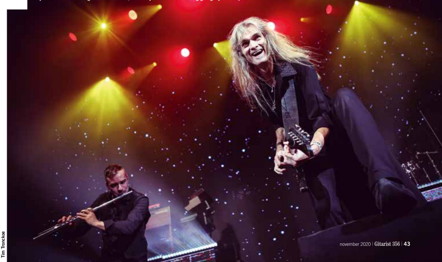
Zijn nieuwe release is geen metalalbum, maar Arjen Lucassen zet nog graag zijn voet op de monitor

Ga naar Gitarist.nl voor extra's: Bekijk de uitgebreide trailer van het album en diverse video's gefilmd in de studio tijdens de opnames. Plus interviews met de muzikanten door Arjen Lucassen zelf.