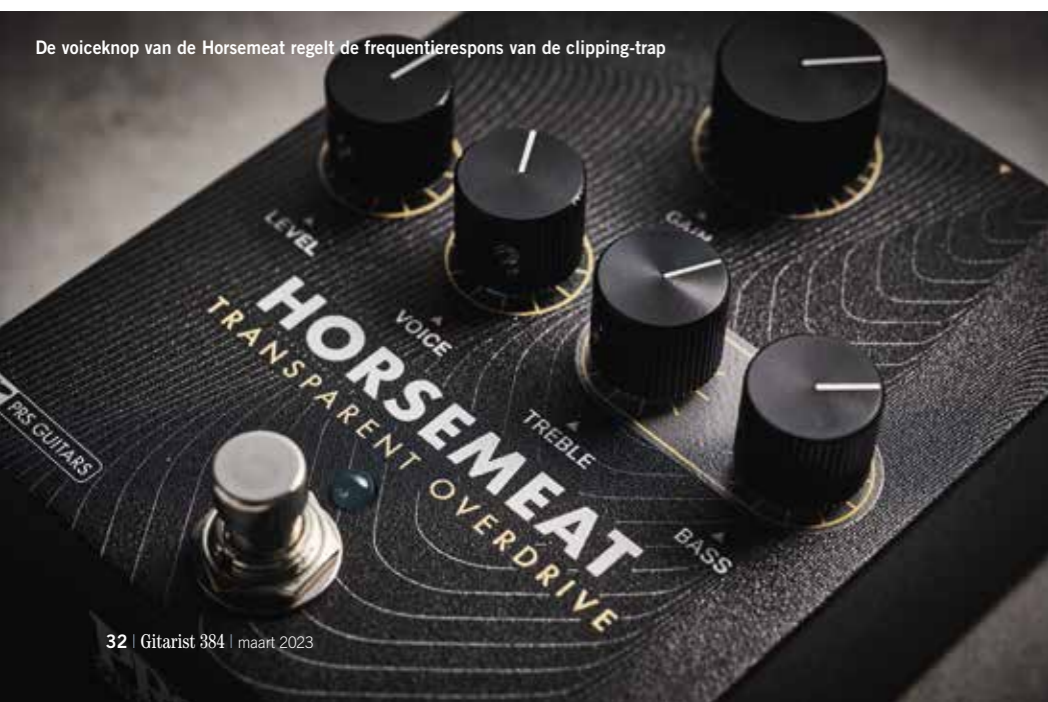
De voiceknop van de Horsemeat regelt de frequentierespons van de clipping-trap

De naam 'Horsemeat' verwijst duidelijk naar het legendarische Klon Centaur pedaal. Een centaur