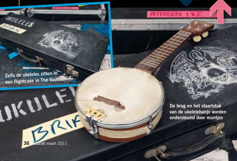
Zelfs de ukeleles zitten in een flightcase in The Vault

ment zijn waarmee ik dat nummer destijds heb opgenomen (ik had er een paar bij me in de studio). Ik weet wel zeker dat ik op tournees altijd deze ukelelebanjo bij me had. Ik had er meestal een stuk schuim-plastic omheen zodat ik hem tegen de bovenkant van mijn gitaar kon drukken. Het was erg leuk om zoiets tevoorschijn te halen en erop te spelen; dat was wel het laatste wat mensen verwachtten."