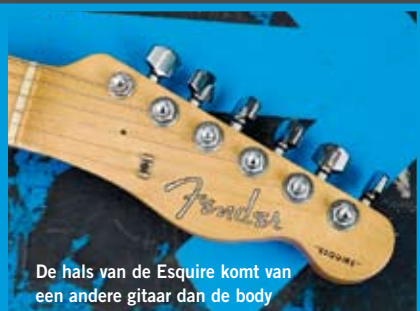
De hals van de Esquire komt van een andere gitaar dan de body

Bekend van: Crazy Little Thing Called Love (The Game, 1979)