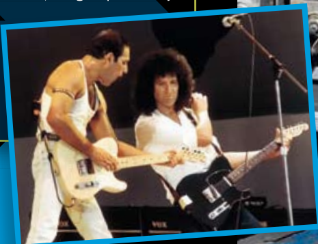
De zwarte Telecaster is uit 1978 en is helemaal origineel

Je kunt best halverwege een song van gitaar wisselen, als je dat maar oefent. Het is net als iemand de hand schudden; dat gaat prima als je weet waar de hand van de ander is. Ik geef hem een gitaar en hij geeft mij de andere met de band al omhoog zodat ik er alleen in hoef te springen, snap je? Je moet het even doorhebben. Je moet alleen niet in paniek raken, want dan gaat het mis."