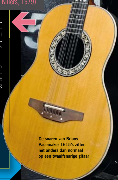
De snaren van Brians Pacemaker 1615's zitten net anders dan normaal op een twaalfsnarige gitaar