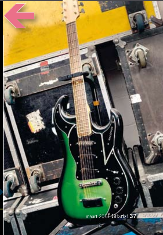
Volgens Brian inspireerde deze gitaar hem tot het schrijven van Long Away

We hebben Long Away een paar keer live in Japan gespeeld en laatst nog met de band van Taylor Hawkins ( The Coattail Riders ). Ik had nee moeten zeggen want ik heb die song niet echt meer in de vingers, maar Taylor wilde het graag en het was best leuk om weer te doen. Het is best een lastige song om live te spelen. Het is mijn ervaring dat de dingen die je zonder nadenken kunt spelen, live vaak het best overkomen."