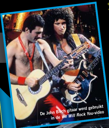
De John Birch gitaar werd gebruikt in de We Will Rock You-video

Ik brak regelmatig snaren. Door de adrenaline wil je live wel eens wat verder doordrukken dan normaal. Dus ja, dan pakte ik deze gitaar en dat ging dan wel, maar het was het gewoon net niet. Heel frustrerend. Toch is het best een goed gebouwd instrument."