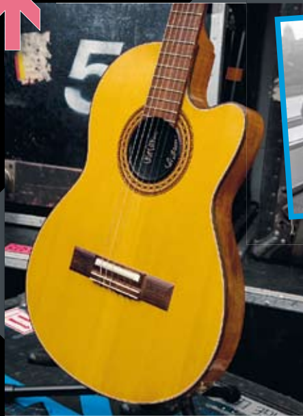
Dit Gibson Chet Atkins model is handig voor live-optredens