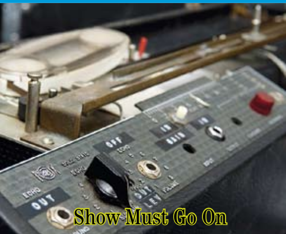
Show Must Go On

Op de foto zie je hoe Brians eerste set-up er ongeveer uit zag: een Vox AC30 Bass uit 1963 en Brians originele Rangemaster. Wat er niet bij past, is Brians bijna twintig meter lange kruisnoer dat hij gebruikte tijdens de Magic-tour van 1986, tijdens het optreden in het Wembley-stadion en waarschijnlijk ook tijdens Queens laatste optreden in Knebworth Park.