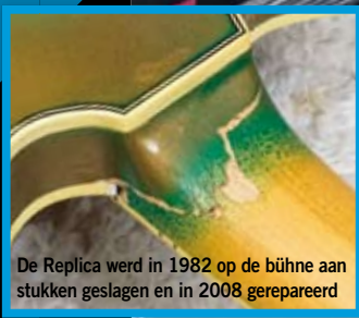
De Replica werd in 1982 op de Bühne aan stukken geslagen en in 2008 gerepareerd

Brian May is uniek in de geschiedenis van rock-gitaar omdat hij zo'n beetje zijn hele carrière lang, in de studio en live, maar één gitaar heeft bespeeld. Daarbij komt nog dat hij die gitaar zelf heeft gebouwd, in het schuurtje bij zijn ouderlijk huis. Wie zich niet echt in de band Queen heeft verdiept, zal verbaasd staan dat al die verschillende gitaargeluiden uit één instrument komen. Zelfs Eddie Van Halen, de enige andere gitarist die stadions wist te vullen en veel successen behaalde met een zelfgebouwde gitaar, dumpte zijn gestreepte Frankenstein gitaar toen hij een contract sloot met Ernie Ball.