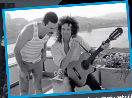
Deze Chet Atkins werd live en in de studio gebruikt