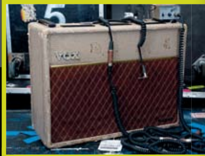
Brians eerste AC30's zagen er niet uit, maar klonken geweldig

Niet alle Alnico's waren blauw: de Celestion T530 – misschien wel de beste gitaarluidspreker aller tijden