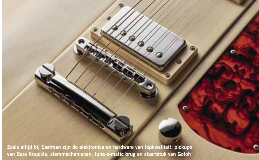
Zoals altijd bij Eastman zijn de elektronica en hardware van topkwaliteit: pickups van Bare Knuckle, stemmechanieken, tune-o-matic brug en staartstuk van Gotoh

Recht uit de koffer voelen beide gitaren prima aan. De actie is precies zoals Eastman die voorschrijft: 2,38 mm aan de baskant en 1,58 mm aan de andere zijde bij de twaalfde fret. De halzen hebben een slank medium C-profiel, wat perfect bij deze gitaren past. De 43 mm brede topkam en 305-mm (12-inch) radius van de ebbenhouten toets voelen als oude vrienden. Qua diepte meten beide 21,5 mm bij de eerste fret en iets meer dan 24 mm bij de twaalfde. Volgens de specificaties is de mensuur, net als die van Fender, 648 mm (25,5 inch) terwijl wij hem op 644 mm, dus iets korter, meten. In combinatie met de medium jumbo Jescar frets (ongeveer 2,59 mm breed bij 1,2 mm hoog), levert dat een gitaar op waarop vrijwel iedereen zich thuis zal voelen. De diepzwarte ebbenhouten toetsen zijn soepel en slank en de frets zijn uitstekend afgewerkt. Zoals gezegd zijn de Juliets zowel zittend als staand comfortabel bespeelbaar. Balans en gewicht zijn precies goed, en hoewel hun massa vergelijkbaar is met die van een SG, hebben ze niet het probleem van dat model dat de twaalfde fret zich bevindt op de plek waar je de vijftiende verwacht. Als je een Strat gewend bent, staan je bij het bespelen van een Juliet geen verrassingen te wachten.