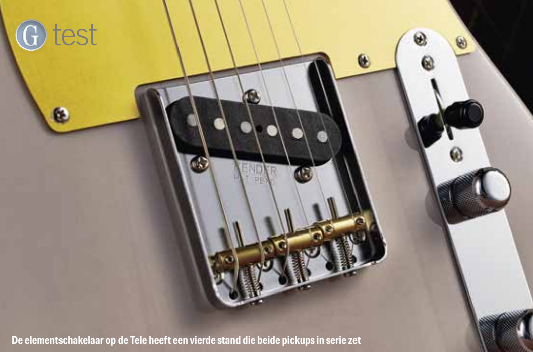
De elementschakelaar op de Tele heeft een vierde stand die beide pickups in serie zet

goede, bruikbare sounds is een bonus. We vonden met name de twee uit fase-geluiden van de Tele interessant, misschien ook omdat we die niet eerder hadden gehoord (hoewel ze ook op enkele andere modellen beschikbaar zijn). Ook de gebruikelijke sounds zijn dik in orde. Hetzelfde geldt voor de Strat: de twee extra geluiden (alle pickups aan en hals en brug tegelijk) voegen extra mogelijkheden toe aan een gitaar die altijd al een van de meest veelzijdige was.