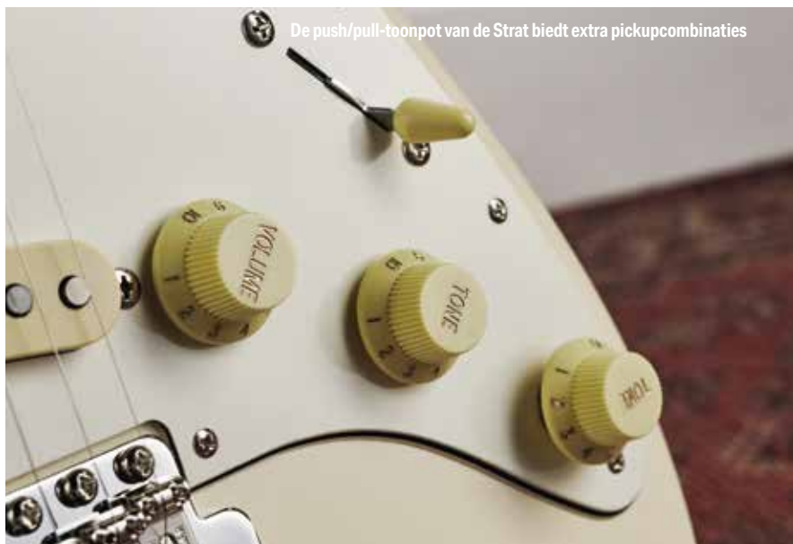
De push/pull-toonpot van de Strat biedt extra pickupcombinaties

Toegegeven, we keken een beetje vreemd op toen we ons voor het eerst realiseerden dat deze gitaren niet waren wat we dachten dat ze zouden zijn. Maar nu we er een paar dagen mee geleefd hebben, is het een heerlijke ervaring gebleken. Of je nu houdt van de geanodiseerde slagplaat van de Tele of niet, of van het nogal ongewone White Blonde dat eigenlijk