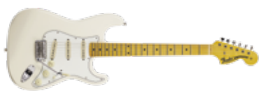
FENDER JV MODIFIED '60S STRATOCASTER

» GITARIST ZEGT: Deze goed gebouwde gitaar biedt veel waar voor zijn geld, met interessante klanken voor een Tele