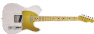
FENDER JV MODIFIED '50S TELECASTER