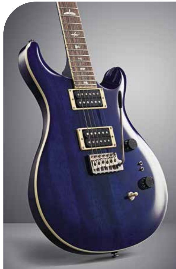
PRS SE STANDARD 24-08