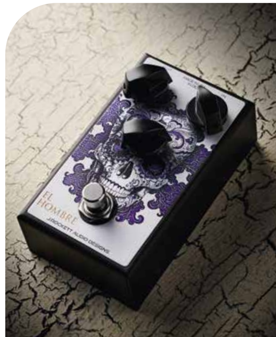
J. ROCKETT EL HOMBRE