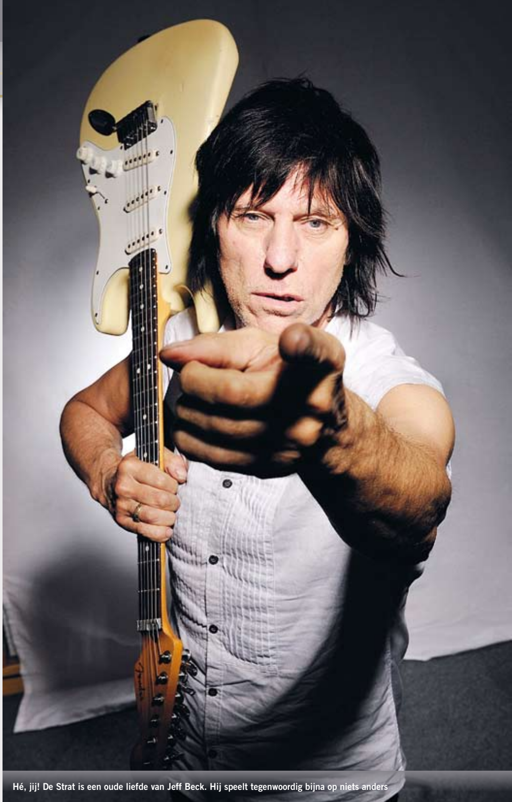
Hé, jij! De Strat is een oude liefde van Jeff Beck. Hij speelt tegenwoordig bijna op niets anders

We hadden een adresje in Londen waar mijn vrienden en ik konden slapen. We hoorden dat Jimi in een club speelde, Blazes volgens mij, een