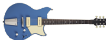
YAMAHA REVSTAR RSP02T

» GITARIST ZEGT: Mooi en resonant ontwerp, goed gebouwd en vol bruikbare geluiden; de Focus Switch zal niet bij iedereen in de smaak vallen