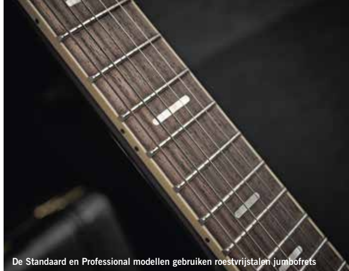
De Standaard en Professional modellen gebruiken roestvrijstalen jumbofrets

Y amaha lanceerde de Revstar-reeks oorspronkelijk in 2015 na een lange voorbereiding.