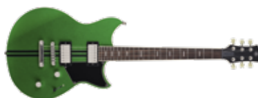
YAMAHA REVSTAR RSS20

Een van de slogans waarmee de oorspronkelijke Revstars aan de man gebracht werden, was 'Net anders genoeg' en dat geldt nog steeds voor deze modellen van de tweede generatie. Ze proberen niet een 'betere' uitvoering van een klassiek ontwerp te zijn. In plaats daarvan doen ze hun eigen ding en dat past bij Yamaha, net als hun uitstekende bouwkwiteit en unieke uitrusting. G