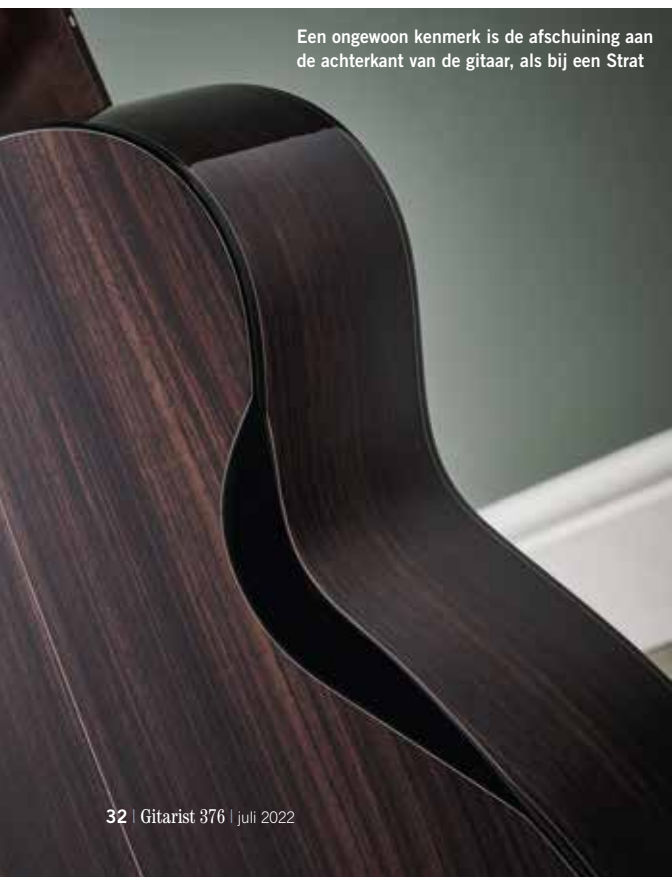
Een ongewoon kenmerk is de afschuining aan de achterkant van de gitaar, als bij een Strat

De Yellow Deluxe ligt prettig in je handen. De hals met zijn subtiele V-vorm is erg comfortabel. Het is bepaald niet de honkbalknuppel van een Strat of Tele uit de jaren vijftig, maar voelt substantieel en tegelijkertijd precies goed aan. Furch vertelde ons dat ze halzen met verschillende breedtes kunnen leveren, van 43 t/m 48 mm. De breedte van de Yellow Deluxe zit daar met