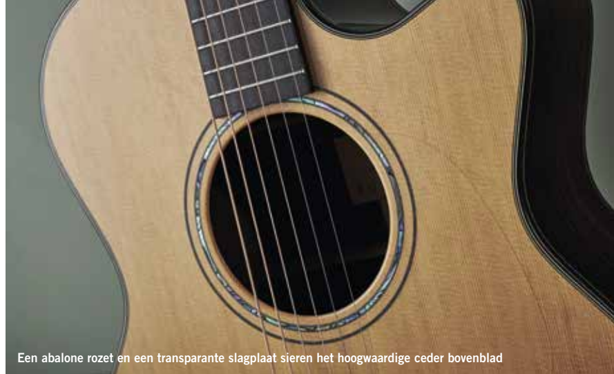
Een abalone rozet en een transparante slagplaat sieren het hoogwaardige ceder bovenblad

45 mm tussenin en loopt uit naar 57 mm bij de veertiende fret.