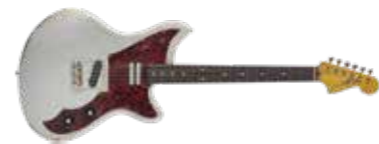
KAUFFMANN COZY TL

fecte element voor deze gitaar. Dat is een uniek uitzienende en heldere humbucker die klinkt als een klok. Is de TL een oude Fender, waar de TM een oude Gibson is? Zoiets.