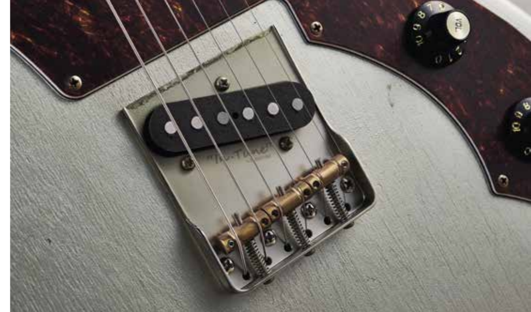
Het brucelement van de Cozy TL is een eigen ontwerp van Kauffmann

Deze gitaren stellen op geen enkel gebied teleur. Ze zijn licht in gewicht en spelen zittend of met een draagband bijzonder comfortabel. Ze zijn perfect afgesteld met een halsprofiel