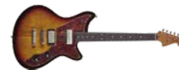
KAUFFMANN COZY TM

» GITARIST ZEGT: Je moet deze gitaar proberen, ook als de afwerking je niet aanstaat