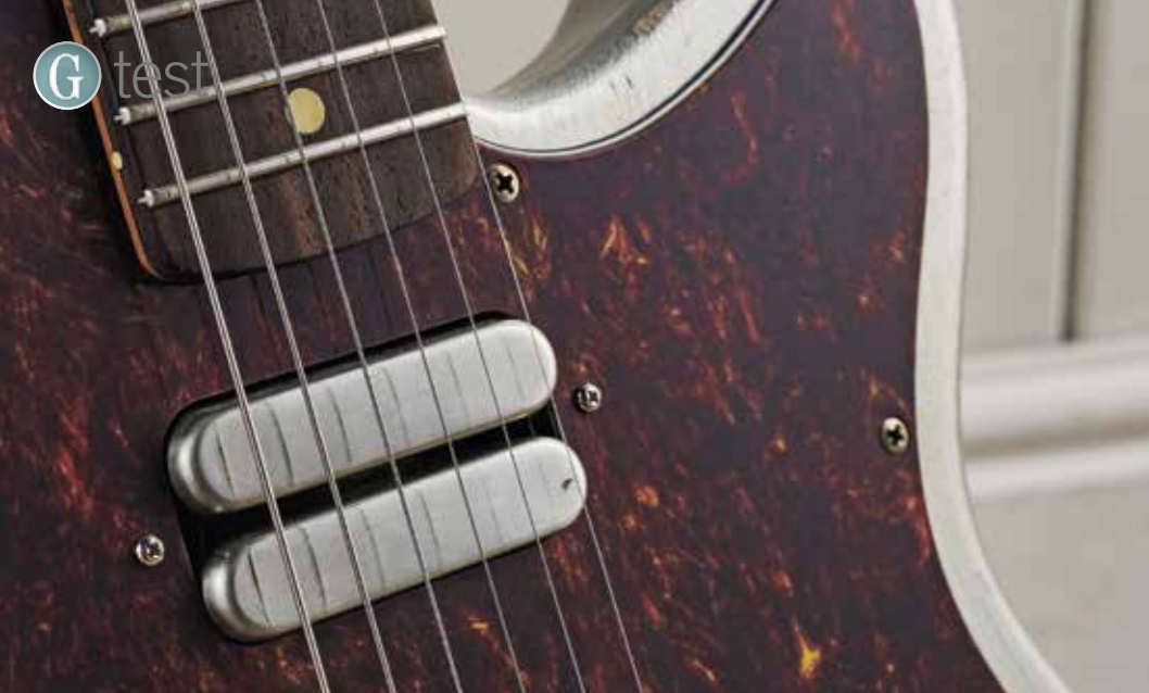
De 'dubbele Tele-halspickup' humbucker was oorspronkelijk ontworpen voor Keith Richards

» eenmansbedrijfjes halzen en body's in elke gewenste vorm en van constante kwaliteit kunnen produceren.