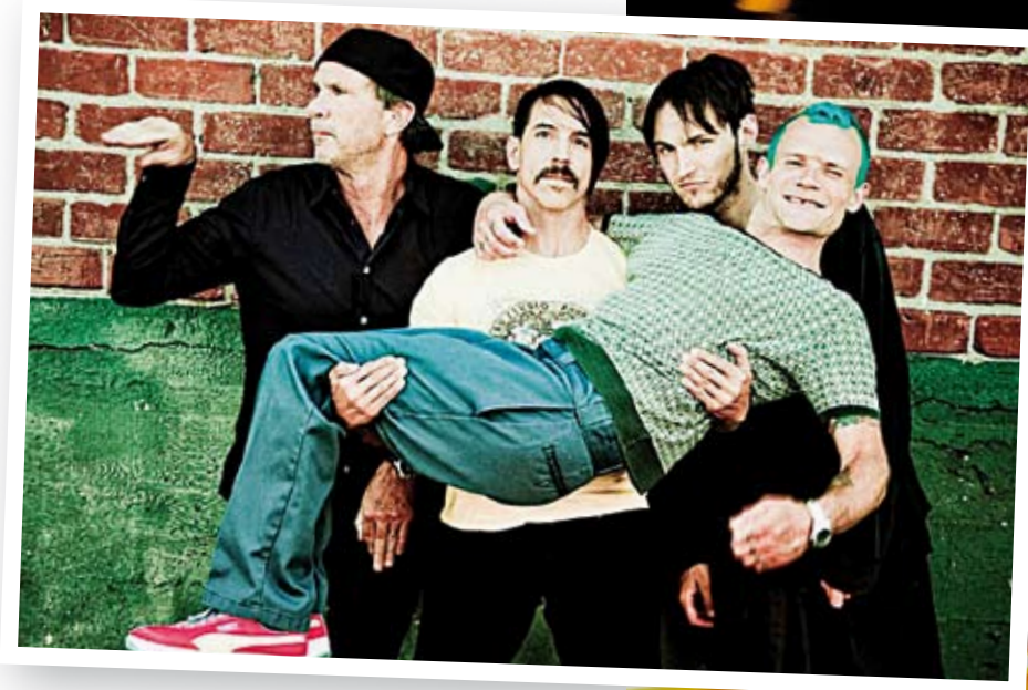
Ellen von Unwerth

'Op een zekere manier wel, ja. Het is mijn werk, als je het al werk wilt noemen. We zijn er natuurlijk een tijdje tussenuit geweest. Het was heel goed dat we dat gedaan hebben, het was voor het eerst sinds John er weer bij kwam in '98. We dachten: laten we even een jaar lang doen alsof we niet de Chili Peppers zijn. Dat beviel een jaar lang zo goed dat we hebben besloten om er twee jaar van te maken. Het is belangrijk om ook een leven te leiden naast de Peppers, andere dingen te doen en even afstand >>