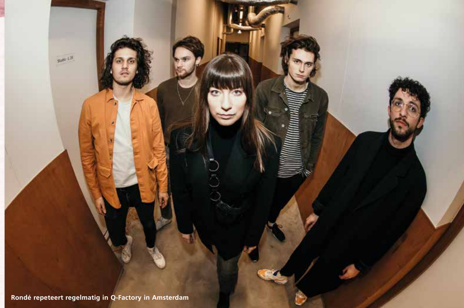
Rondé repeteert regelmatig in Q-Factory in Amsterdam

6. CLUBTOUR EN LOWLANDS 2015 In de nasleep van Eurosonic Noorderslag en de deal met Universal Music Publishing Benelux stapten de concerten zich op. En Rondé verkoopt meermaals popzalen