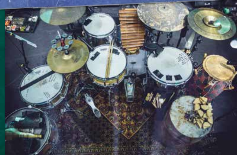
Joosts bijzondere drumsetup met o.a. twee snares, een olievat en een conga