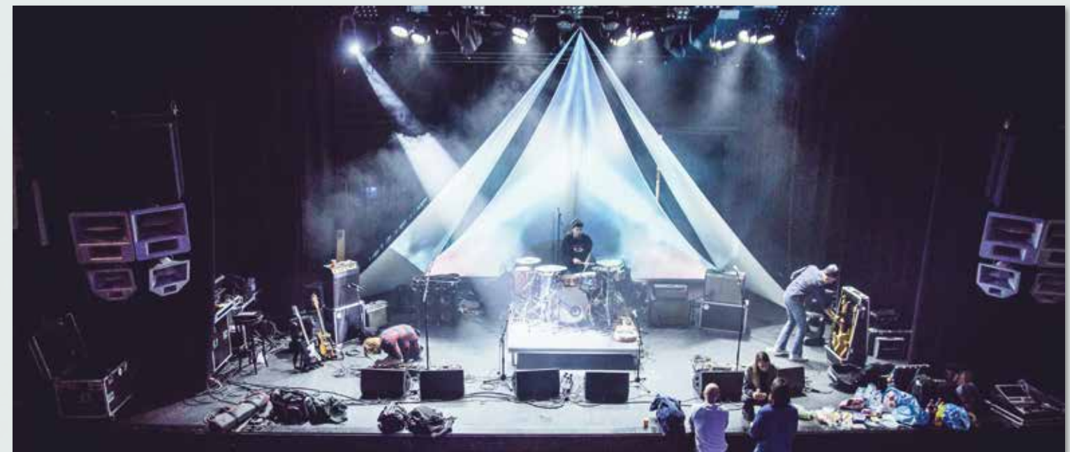
Alles podiumklaar maken