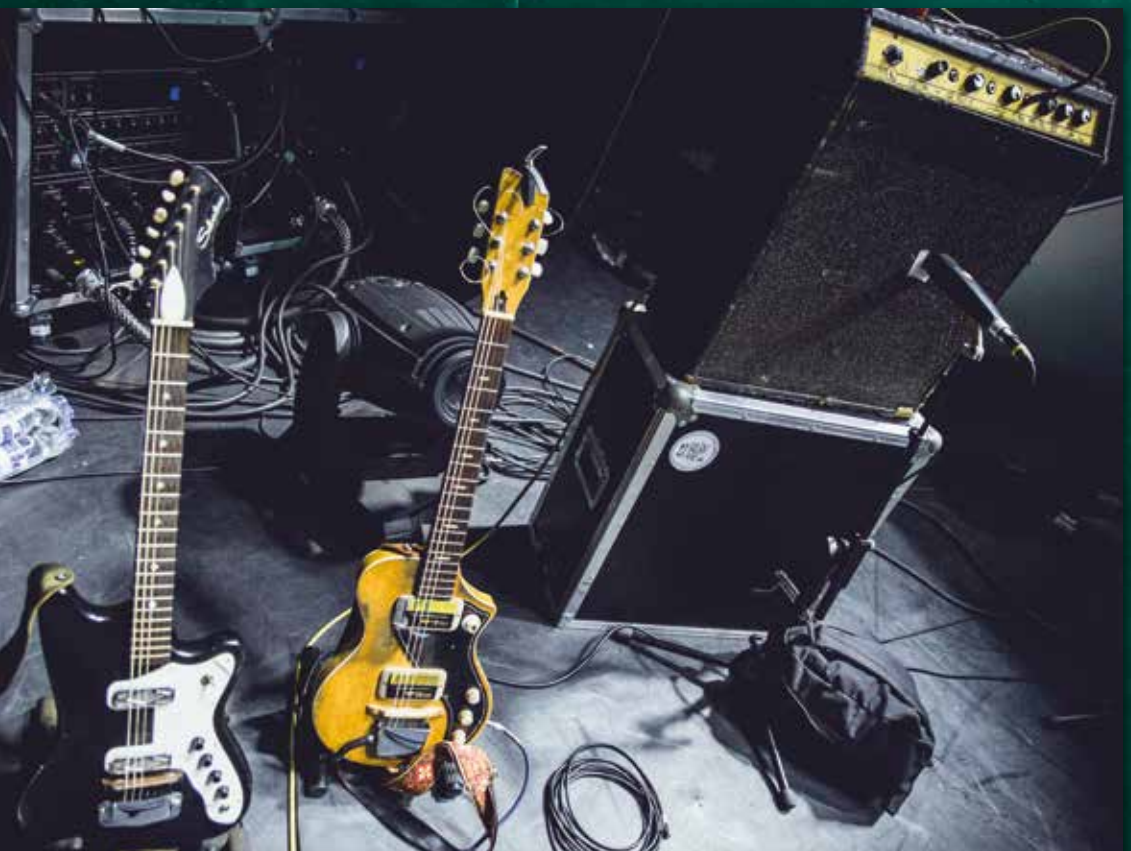
← Cato's hoekje met v.l.n.r. haar Silvertone 1476, Guyatone LG-50 en Davoli Special-amp

Baby's improvisatiestijl. We hebben met de crew overlegd dat we dit eerst gaan proberen. Misschien wordt het uiteindelijk totaal anders. Het kan zelfs zo zijn dat we de minuut voor een show besluiten om de boel op zijn kop te gooien. Dat blijft leuk.'