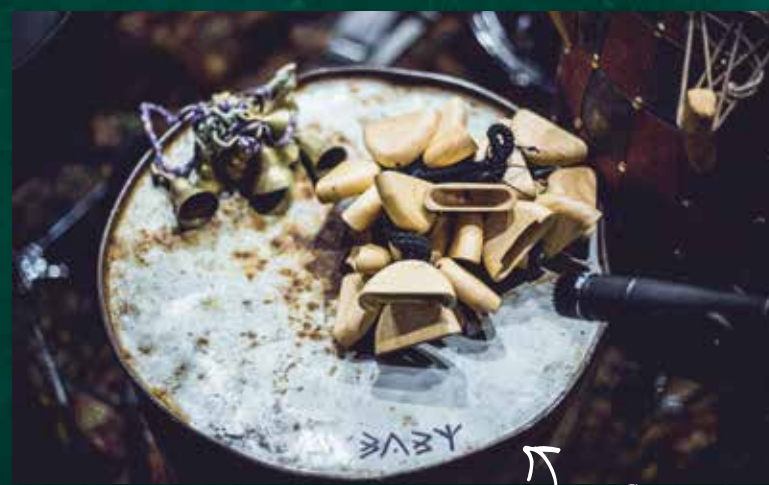
Een olievat als floortom