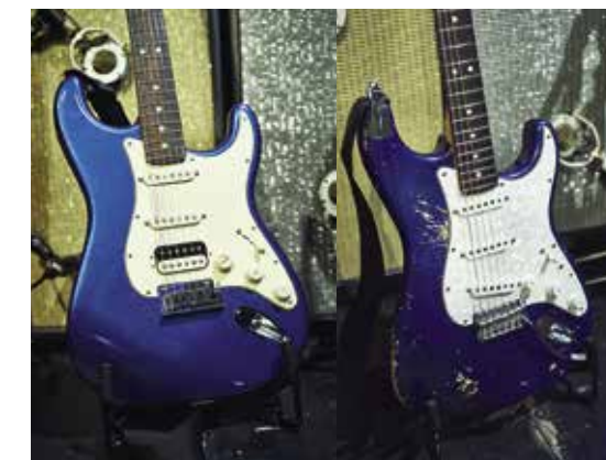
Cory heeft de Amerikaanse Ultra Strat (links) pas. Zijn werkpaard is de Fender Highway One Stratocaster (rechts)

VIDEO: Cory Wong - Live @ First Avenue - Full Show