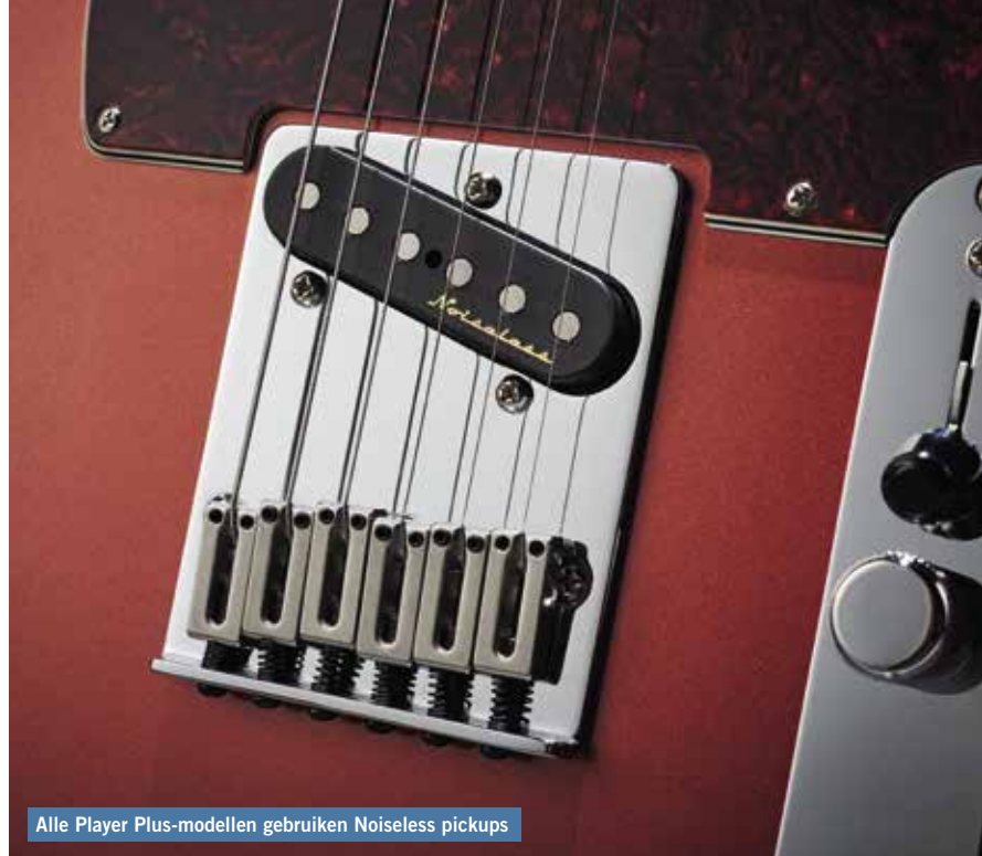
Alle Player Plus-modellen gebruiken Noiseless pickups

uit in het stijlvolle metallic blauw dat Fender Opal Spark noemt; onze Tele is meer koperkleurig - ook metallic - en die kleur heet Aged Candy Apple Red. Beide zijn ook verkrijgbaar in het traditionele 3-kleuren sunburst en, aan de andere kant van het spectrum, in kleuren die in elkaar overlopen, zoals Tequila Sunrise en Silver Smoke. Maar de vernieuwing zit niet alleen in de afwerking. Fenders behoudzame aanpak van innovatie is op allerlei fronten zichtbaar.