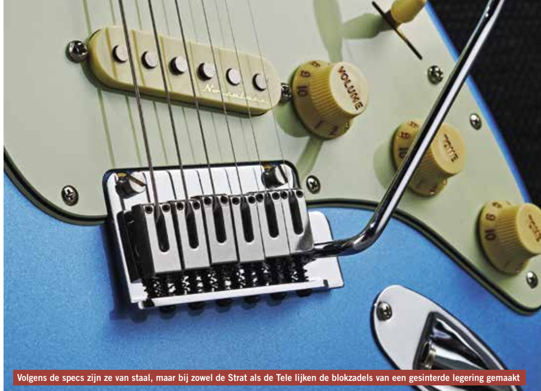
Volgens de specs zijn ze van staal, maar bij zowel de Strat als de Tele lijken de blokzadels van een gesinterde legering gemaakt

De ruisonderdrukkende Noiseless pickups en de vlakkere radius (305 mm/12 inch ten opzichte van