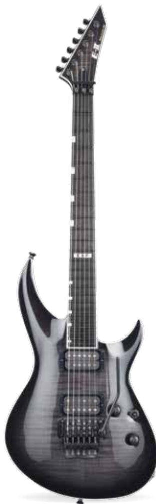
ESP E-II HORIZON-III FR

Door zijn eenvoudige opzet zou je de M-I als een one trick pony kunnen zien, maar daarmee doe je