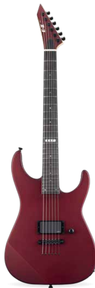
ESP E-II M-I THRU NT

» GITARIST ZEGT: Veelzijdige moderne superstrat