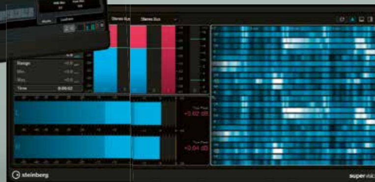
Bekijk het signaal op diverse manieren en van alle kanten met de nieuwe meterplug-in Supervision

Cubase had al een uitgebreide metersectie, maar nu is er de speciale SuperVision plug-in met een modulaire opzet. Je kunt de meter dus net zo configureren als je wilt en er is een indrukwekkend aantal modules. Als muzikant vond ik het chromogram bijvoorbeeld erg handig, dat het signaal als spectrum tegen een referentiebaak met nootnamen laat zien. Uitbreidingen aan bestaande plug-ins zijn er ook. Zo heeft de 8-bands parametrische eq-plug-in een functie gekregen voor dynamische eq die voor elke band kan worden in- of uitgeschakeld. Met Dyn ingeschakeld op de Dynamic EQ reageert de betreffende band eigenlijk als een soort compressor op de gekozen frequentieband. Als het betreffende frequentiegebied boven de ingestelde drem- >>