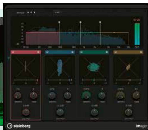
Het stereobeeld van hoog tot laag onder controle met Imager

pel komt, wordt het niveau dynamisch gecorrigeerd. Dynamische banden kunnen elk zelfs een eigen sidechain-input krijgen, en daarmee komen we meteen op nog een uitbreiding voor de plug-in-functionaliteit van Cubase. Sidechaining was al heel makkelijk via een speciale knop op de Cubase plug-ins die dit ondersteunen, maar dat kunnen er in Cubase 11 nu ook meerdere tegelijk zijn. Bij de 8-bands frequency eq-plug-in dus maximaal acht. Het interne signaal van deze plug-in kan natuurlijk ook als sidechain-input worden gebruikt.