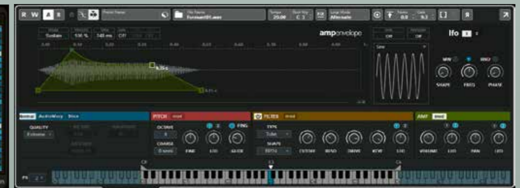
Sampler Track 2.0 wordt al een echte (re)synthesizer.