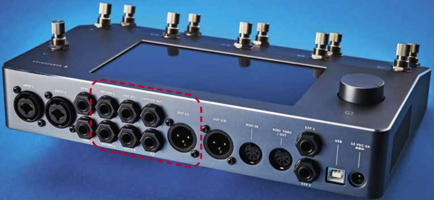
Met de Neural Capture-functie kun je je eigen versterkersimulaties maken

» Net als Kemper bij het profileren, stuurt Neural Capture een test-sigitaal door je versterker of overdrivepedaal. We hebben dit getest met een Orange Dark Terror en waren compleet onder de indruk van de snelheid en accuratesse waarmee de Neural Capture werd gecreëerd.