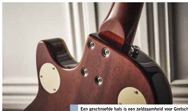
Een geschroefde hals is een zeldzaamheid voor Gretsch