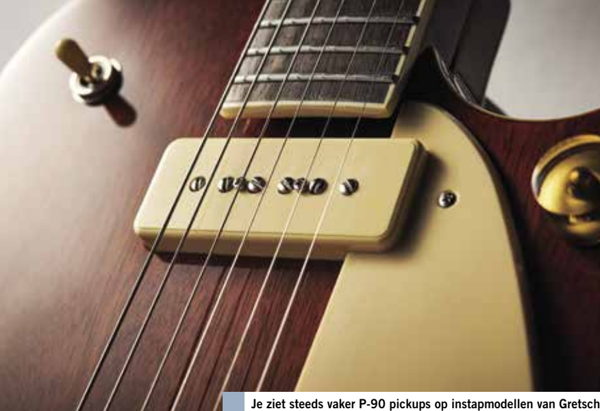
Je ziet steeds vaker P-90 pickups op instapmodellen van Gretsch