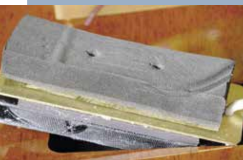
We vervangen het te dikke schuimrubber onder de P-90

Drie elektronica-ruimtes is ongebruikelijk en dat geldt ook voor het circuit. Als eerste valt op het treble-bleedcircuit van de 500 kohm volumepotmeter, dat een 150 kohm weerstand combineert met een parallel geschakelde 0,01 microfarad condensator. De waarde van de weerstand is vrij gebruikelijk, maar die van de condensator is dat niet: meestal wordt namelijk gekozen voor 0,001 of 0,002 microfarad. Deze laat veel meer dan alleen het hoogste hoog door, wat in de praktijk bijna als een laag-af filter klinkt. Daarbij zijn ook de volume- en toonregelaar op de vintage manier met elkaar verbonden, wat betekent dat er volop interactie tussen beide plaatsvindt. Dat pakt in de praktijk overigens goed uit. Direct uit de doos overheerste de P-90 bij de hals het brugelement nogal en het lukte ons niet die te verlagen, wat meestal betekent dat hij direct in de body geschroefd is. Er bleek echter een flink stuk schuimrubber onder te zitten dat duidelijk te groot en te hard was. Vervang dat door een dunner, meer elastisch stuk en je kunt je pickup een stuk lager plaatsen, zoals gebruikelijk met deze montage.