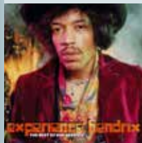
Jimi Hendrix Experience Hendrix: The Best Of... Het zou zonde zijn om je tot

mooie ideeën die je allemaal kunt overnemen! Het titelnummer is eveneens een goed voorbeeld van een stijl die zeker van invloed is geweest op John Mayer. Als je toch aan het luisteren bent, pik dan in elk geval ook Pride And Joy mee. Dat is een uptempo track die misschien niet direct relevant lijkt voor ons verhaal, maar luister eens naar de slaggitaar om de benadering op te pikken die je zal helpen met de snellere licks.