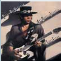
Stevie Ray Vaughan Texas Flood Lenny van het 'Texas Flood'-album zit vol

mooie ideeën die je allemaal kunt overnemen! Het titelnummer is eveneens een goed voorbeeld van een stijl die zeker van invloed is geweest op John Mayer. Als je toch aan het luisteren bent, pik dan in elk geval ook Pride And Joy mee. Dat is een uptempo track die misschien niet direct relevant lijkt voor ons verhaal, maar luister eens naar de slaggitaar om de benadering op te pikken die je zal helpen met de snellere licks.