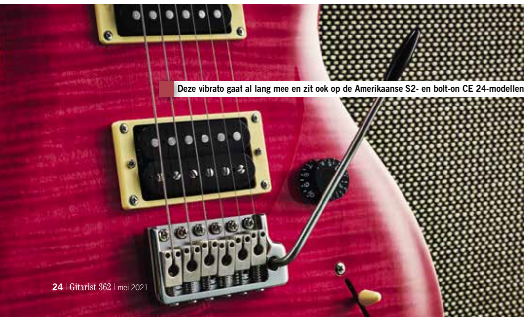
Deze vibrato gaat al lang mee en zit ook op de Amerikaanse S2- en bolt-on CE 24-modellen

soort. De door PRS ontwikkelde vibrato is wel dezelfde als gebruikt op de (goedkopere) Amerikaanse S2 gitaren en dezelfde als op onze veel duurdere CE 24. Dit ontwerp heeft zich de afgelopen jaren wel bewezen en is hier parallel aan het bovenblad van de gitaar gemonteerd. Je drukt de vibratoarm eenvoudig in de daarvoor bestemde holte, waarbij de weerstand van het systeem kan worden afgesteld. Waar de vibrato's van de Core-reeks geperst zijn, zijn die van de SE gegoten. Zowel de topplaat als het blok zijn van staal; bij de Core instrumenten is dat messing. Dus het antwoord is ja, deze SE's zijn anders, maar voldoen volledig aan de zorg voor detail die PRS kenmerkt. Alles zit op zijn plek en zelfs als we de kwaliteit van de tekening van de esdoornfineer tops vergelijken met die van de CE die we als referentie gebruiken, zien we niet veel verschil.