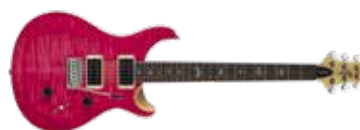
PRS SE CUSTOM 24

Toch, met in feite dezelfde hardware en pickups komen deze SE's dicht in de buurt van de S2-reeks, terwijl geen enkele S2 het speciale TCI-circuit heeft van onze 24-08, noch het uitgebreide schakelsysteem. Kortom, de SE gitaren hebben de wind mee. Goed ontwerp, prachtig uitgevoerd en geluiden die alsmaar beter lijken te worden: een heleboel gitaar voor je geld. G