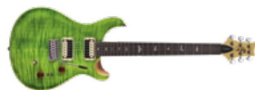
PRS SE CUSTOM 24-08