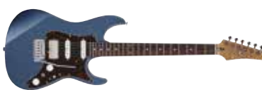
IBANEZ AZ2204N PBM

Met zowel de AZ2204N als de AM2000H laat Ibanez wederom zien dat ze op twee verschillende gebieden uitstekende gitaren maken. De AZ2204N is een echte alleskunner en zal door zijn vintage karakter meer de allround gitarist aanspreken dan de gemiddelde metalhead. Ik ga er vanuit dat het probleem met de topkam exemplarisch is, maar daarnaast is het heel makkelijk te verhelpen door een goede luthier. De AM2000H is een degelijke en prachtige gitaar die veel meer in zijn mars heeft dan je op het eerste gezicht zou denken. G