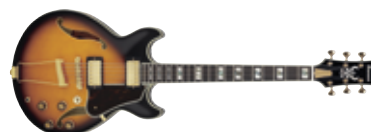
IBANEZ AM2000H BS

» GITARIST ZEGT: Veelzijdige, moderne superstrat.