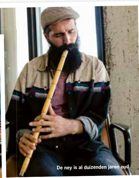
De ney is al duizenden jaren oud