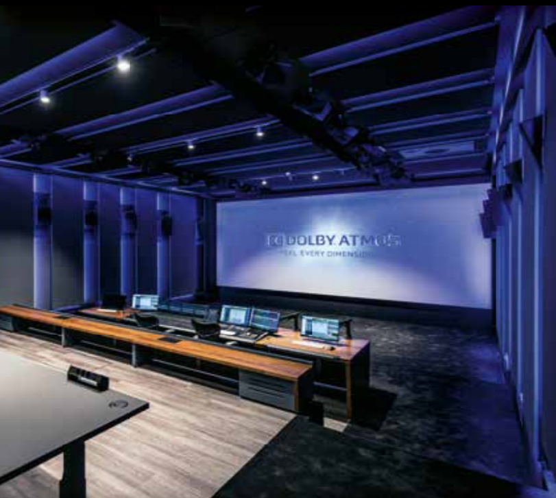
De Mix Stage kreeg de hoogst haalbare certificering: Dolby Atmos Premier Studio.

maar je moet het wel kunnen sturen. Deze studio is zo ontworpen dat de wanden en plafond het geluid deels sturen en absorberen.’ In deze studio’s kunnen artiesten hun eigen laptop inplukken op usb/hdmi, en direct aan de slag. De aanwezige class compliant audio- en midi-apparatuur is dan gelijk actief, maar ze kunnen