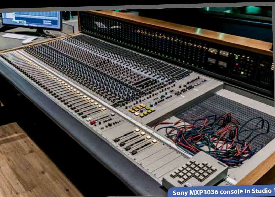
Sony MXP3036 console in Studio 1

speakerkast zelf tot de gehele voorwand.