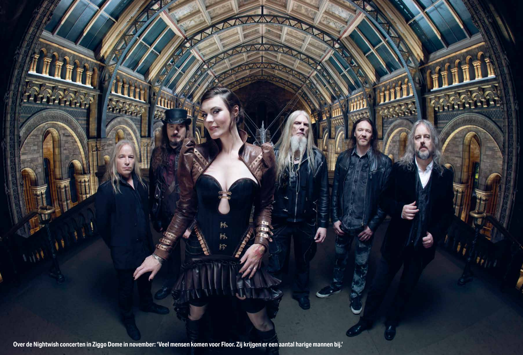
Over de Nightwish concerten in Ziggo Dome in november: 'Veel mensen komen voor Floor. Zij krijgen er een aantal harige mannen bij.'

> Zo belanden we bij een van de opvallendste instrumenten van Marko: zijn zwarte Infinity/Panthera-doubleneck, een hybride van een Warwick Infinity-bas en een Framus Panthera-gitaar. 'Het is niet echt een signaturemodel want niemand anders wil op dat ding spelen', lacht Marko. 'Ik zei tegen de Warwick en Framus gasten in de customshop dat ik iets speciaals nodig had en vroeg of ze dat konden maken.' Marko loopt met webcam en al door zijn huis en laat 'm zien. Naast het bijzondere instrument zien we ook een aantal andere bijzondere basgitaren, zoals een Warwick Buzzard en een Warwick Vampyre.