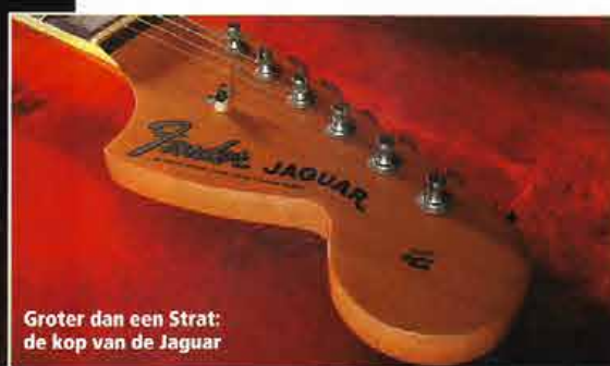
Groter dan een Strat: de kop van de Jaguar

De Jaguar verscheen in 1962 en was de vierde belangrijke zessnaar die Fender op de markt bracht. Hoewel het model sterk was afgeleid van de vier jaar eerder verschenen Jazzmaster, vielen enkele grote verschillen direct op. De hals bevatte een fret meer dan de 21 die standaard op een Fender zaten, maar de mensuur was korter, namelijk 610 mm. Het was hiermee een zogenaamde 'studentengitaar'. Dit zorgde voor een heldere klank en een gemakkelijkere bespeelbaarheid, maar de lagere snaarspanning betekende minder sustain. Dit kwam nog bij de problemen met de sustain die al inherent waren aan de brug en het vibratostaartstuk, overgenomen van de Jazzmaster.