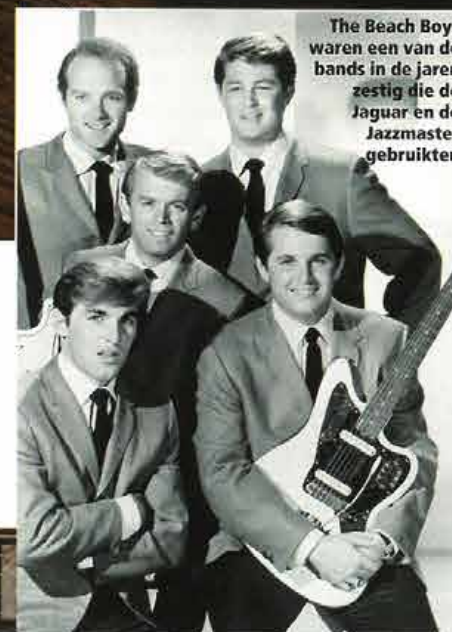
The Beach Boys waren een van de bands in de jaren zestig die de Jaguar en de Jazzmaster gebruikten

gerammel en gezoem zorgde. De beste manier om dit te verhelpen was het omhoog draaien van de hele handel en daarna de hoek van de hals te vergroten (met stukjes hout) voor het herstellen van een fatsoenlijke actie. Het elektrische circuit bevatte twee onafhankelijke regelsystemen; naast de standaardknoppen was er een tweede set rolpotmeters waarmee enkel het halselement bediend werd. Met een schuifschakelaar kon tussen de twee circuits gekozen worden, waardoor vooraf ingestelde solo- en ritmeniveaus mogelijk waren.