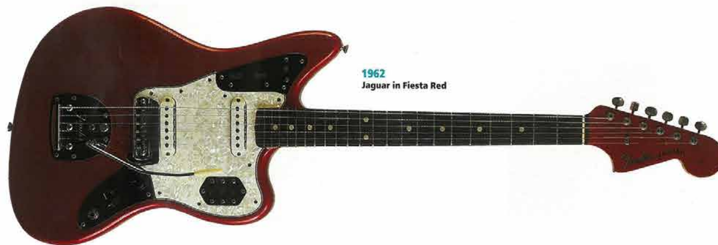
1962 Jaguar in Fiesta Red