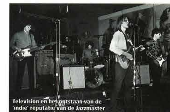
Television en het ontstaan van de 'indie' reputatie van de Jazzmaster