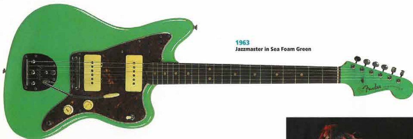
1963 Jazzmaster in Sea Foam Green