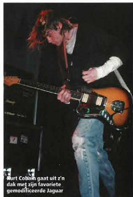
Kurt Cobain gaat uit z'n dak met zijn favoriete gemodificeerde Jaguar

Het grotere aantal eigenaardigheden maakte de Jaguar minder aantrekkelijk dan z'n stalgenoot en het einde ervan kwam dan ook vijf jaar eerder, in 1975. In 1986 werd hij, net als de Jazzmaster, weer tot leven gewekt als onderdeel van Fender Japans repro-serie. Uiteindelijk kreeg de Jaguar in 1999 ook dezelfde erkenning van Fender USA, via de American Vintage-serie. Een variant voor de thuismarkt van Fender Japan bevatte twee humbuckers, een modificatie die al vaak door gebruikers was uitgevoerd. Dit idee werd in 1996 toegepast op de Squier Vista Series Jagmaster, die slechts een korte periode is geproduceerd, en is nog steeds terug te vinden op het Chinese equivalent hiervan, die in 2001 werd gelanceerd. Zoals deze recente variaties op het thema al aangeven, zijn indie, britpop en grunge muziekstijlen waarin beide modellen nieuwe vrienden hebben gemaakt, vaak via opgevoerde exemplaren. J Mascis (Dinosaur Jr), Thurston Moore (Sonic Youth), John Frusciante (Red Hot Chili Peppers) en Kurt Cobain (Nirvana) zijn enkele van de gitaristen die fratsen met het instrument hebben uitgehaald die oom