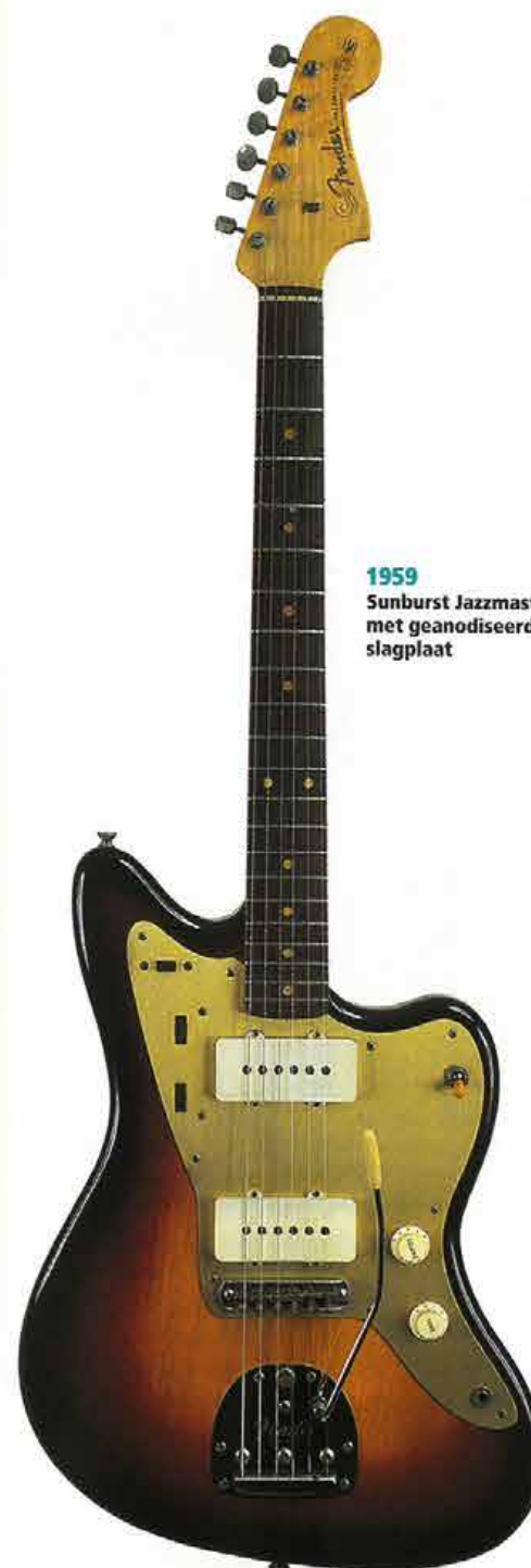
1959 Sunburst Jazzmaster met geanodiseerde slagplaat

De vorm van de slagplaat was ook hetzelfde, maar hij was gesplitst in een plastic midden-deel, dat de elementen omvatte, en twee aangrenzende verchroomde metalen stukken die ieder een stel regelaars behuiste. De een bevatte het ritmecircuit in Jazzmaster-stijl en de ander de mastervolume- en de toonknop.