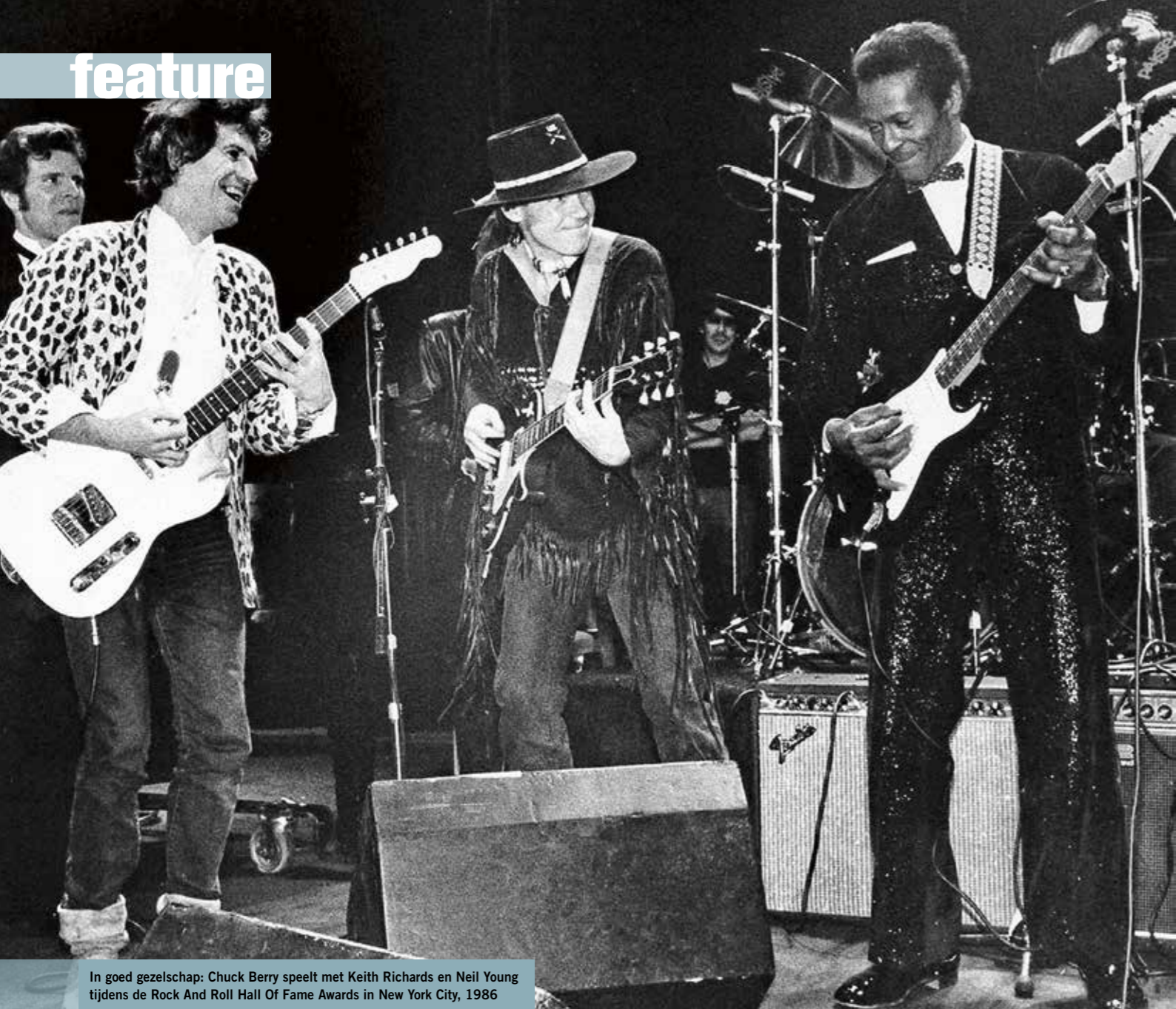
In goed gezelschap: Chuck Berry speelt met Keith Richards en Neil Young tijdens de Rock And Roll Hall Of Fame Awards in New York City, 1986