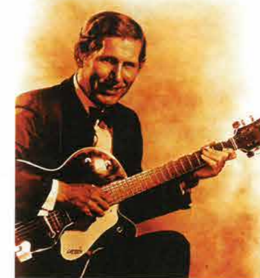
De legendarische Chet Atkins had niet altijd een gemakkelijke relatie met Gretsch