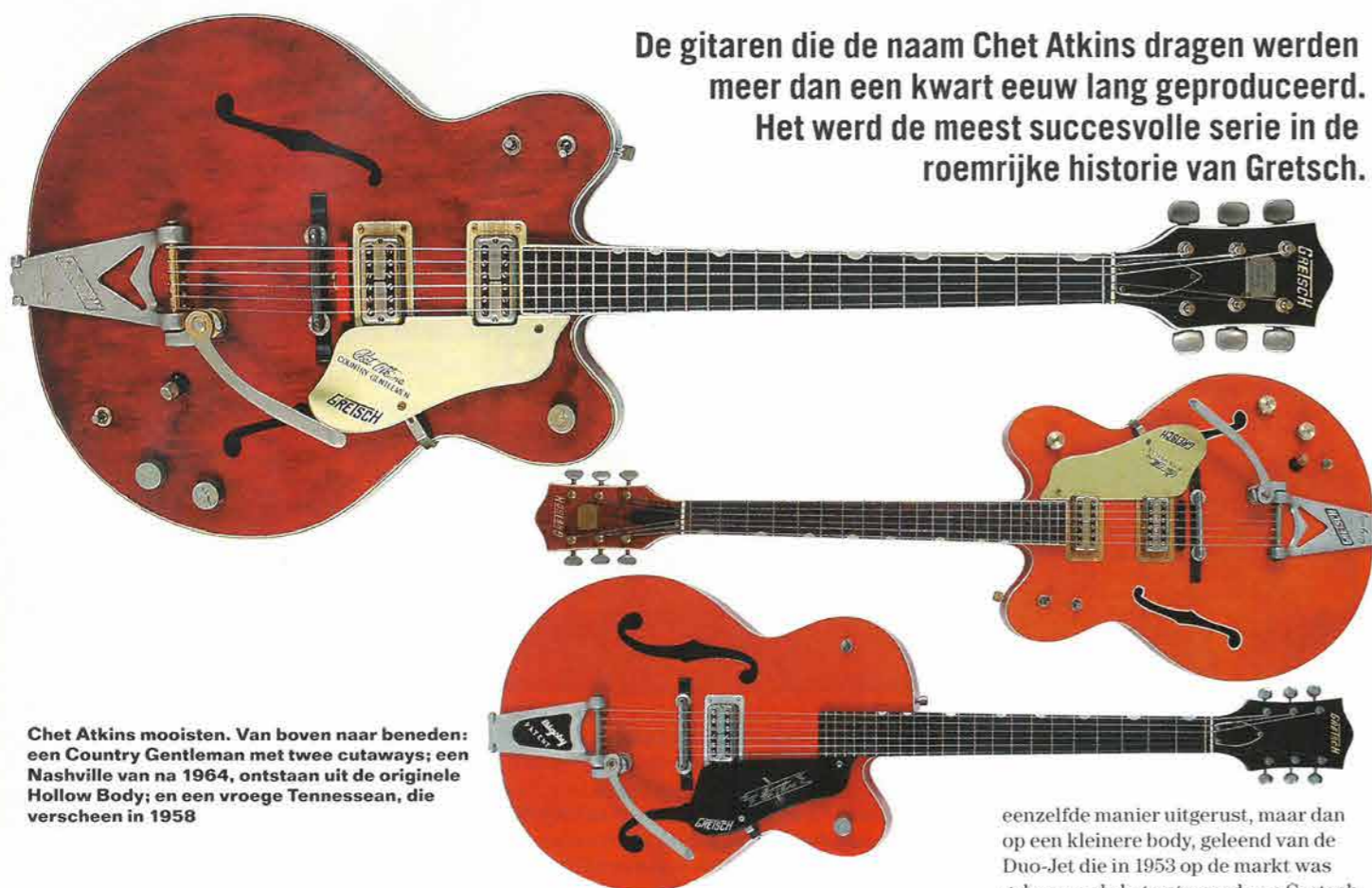
Chet Atkins mooisten. Van boven naar beneden: een Country Gentleman met twee cutaways; een Nashville van na 1964, ontstaan uit de originele Hollow Body; en een vroege Tennesseean, die verscheen in 1958

De gitaren die de naam Chet Atkins dragen werden meer dan een kwart eeuw lang geproduceerd. Het werd de meest succesvolle serie in de roemrijke historie van Gretsch.