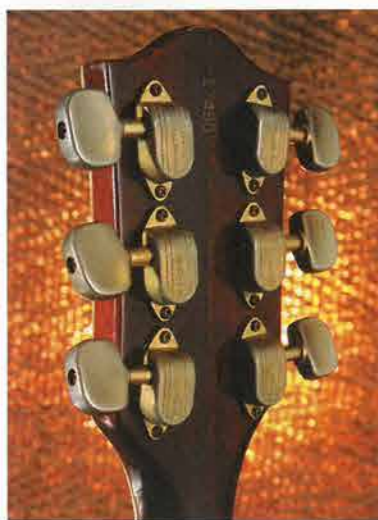
Op twee modellen verscheen een cirkelvormig stuk leer dat de innovatieve toegang aan de achterkant bedekte (foto rechts)

snel verdubbeld, met de toevoeging van de 6122 Chet Atkins Country Gentleman, aan het einde van 1957, en de 6119 Chet Atkins Tennesseean in 1958. Deze twee dunne elektrische archtops hadden dezelfde klasse als de 6120 Chet Atkins Hollow Body. De met mahonie gefinierde Country Gent was zelfs het meest luxueus uitgevoerde Atkins-model, met elegante stemmechanieken en een ebbenhouten toets. De ebbenhouten toets werd rond 1958 echter ook bij de Hollow Body toegepast. De kersenrode Tennesseean was daarentegen het best betaalbare instrument met de handtekening van Chet Atkins. De kosten werden gedrukt door het gebruik van verchromde hardware, een ebbenhouten toets zonder binding en een enkel brugelement.