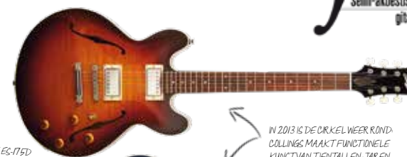
IN 2015 IS DE CIRKEL WEER ROND, COLLINGS MAAKT FUNCTIONELE KUNST VAN TIEN TALEN JAREN OUDE ARCHTOP-ONTWERPEN