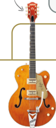
EDDY GAAT NOG ALS EEN SPEER EN WERKTE PAS GELEDEN SAMEN MET...