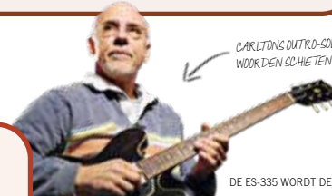
CARLTONS OUTRO-COLOP OP KID CHARLEMAGNE-WOORDEN SCHIETEN TE KORT