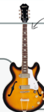
IN 1968 HAALDE JOHN LENNON DE LAK VAN ZIJN SUNBURST CASINO AF

Richard Hawley Speelde van: 1988 tot heden Favoriete semi: Gretsch Country Gentleman, Black Falcon; Gibson ES-335 Luister: Darlin' Wait For Me