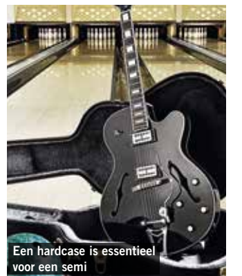
Een hardcase is essentieel voor een semi

Dit lijkt voor de hand te liggen omdat alles wat geheel of gedeeltelijk hol is nu eenmaal minder stevig is dan een massieve plank. Het vervoeren van een semi is daarom risicovoller als je hem alleen in een gigbag meeneemt. Koop een goede koffer en gebruik hem ook!