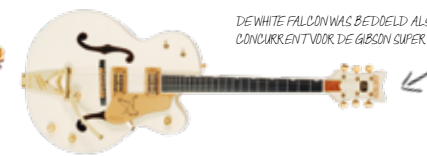
DE WHITE FALCON WAS BEDOELD ALS CONCURRENT VOOR DE GIBSON SUPER 400