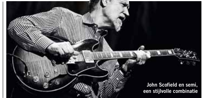
John Scofield en semi, een stijlvolle combinatie

Oude archtops werden ontwikkeld voor veel dikkere snaren dan wij tegenwoordig gebruiken; de extra energie van dikke snaren is belangrijk voor een goed geluid. Gooi er eens een setje 0.013 op! Dat scheelt nogal vergeleken met je 0.009's, maar het is de moeite waard. Probeer voor ouderwetse geluiden ook eens een setje flatwounds in plaats van roundwounds.