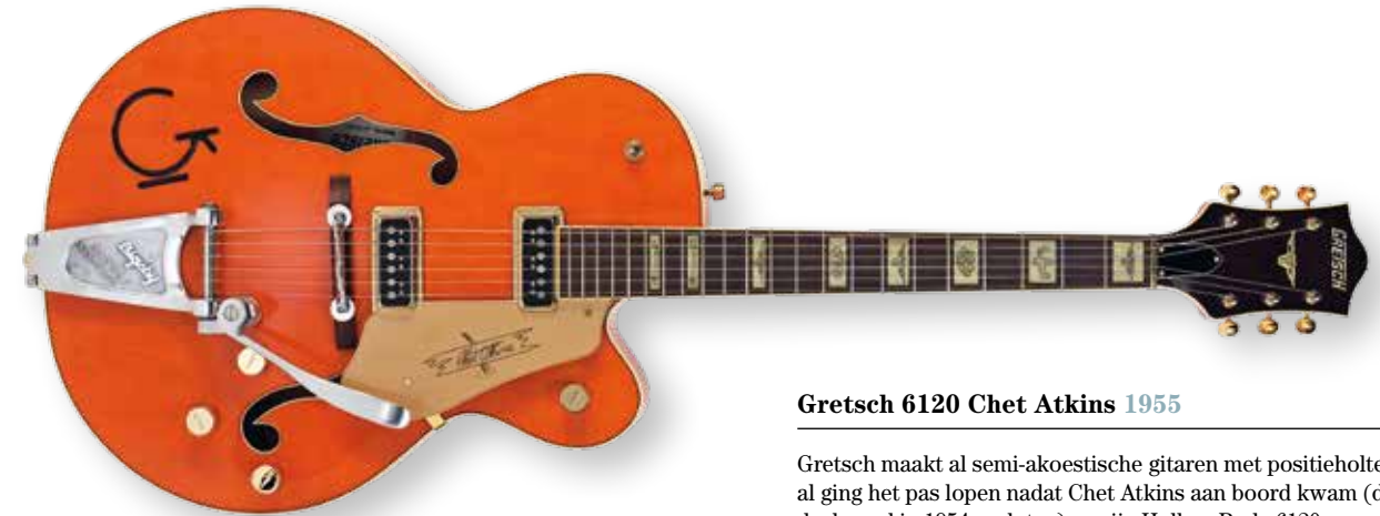
Gretsch 6120 Chet Atkins 1955