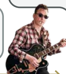
MARRS TREMOLORIFF OP HONN SOON IS NOW? WERD GESPEELD OP EEN CASINO UIT 1963