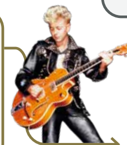
GRETSCH WZD ESSENTIEEL, LEREN BROEK, OPTONEEL

Chris Cheney Speelde van: 1995 tot heden Favoriete semi: Gretsch White Falcon Luister: White Noise