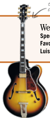
DES STAAT VOOR CUTAWAY ELECTRIC SPANISH