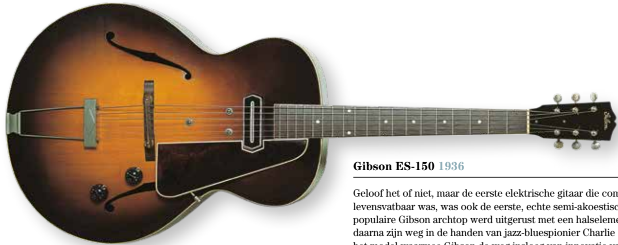
Gibson ES-150 1936