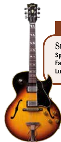
WES MONTGOMERY HAD EEN GOEDE 'AVLOED OP... YES...'

Gary Clark Jr Speelde van: 2005 tot heden Favoriete semi: Epiphone Casino, Gibson ES-335 Luister: Bright Lights