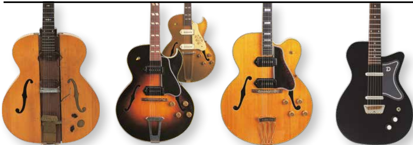
Les Pauls Log 1946

Geloof het of niet, maar de eerste elektrische gitaar die commercieel levensvatbaar was, was ook de eerste, echte semi-akoestische gitaar. Deze populaire Gibson archtop werd uitgerust met een halselement en vond daarna zijn weg in de handen van jazz-bluespionier Charlie Christian. Dit is het model waarmee Gibson de weg insloeg van innovatie van de elektrische gitaar, wat ons uiteindelijk de Les Paul, de ES-335 en al die andere modellen heeft gebracht. In 1942 was het element geëvolueerd in de P-90 zoals we die vandaag nog kennen.