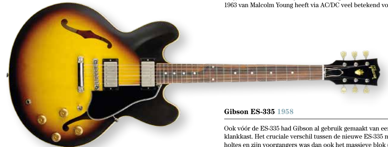
Gibson ES-335 1958

Uiterlijk en klank van Gretsch gitaren deden en doen het goed in rockabilly, en dat zal wel zo blijven ook. De uitgeholde Gretsch Jet Firebird uit 1963 van Malcolm Young heeft via AC/DC veel betekend voor rockgitaar.