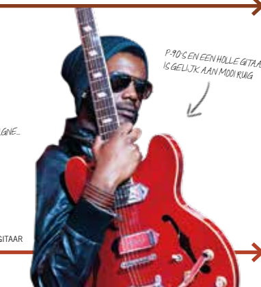
P.RO'S EN EEN HOLLE GITAAR IS GELUK AAN MOO KUNG