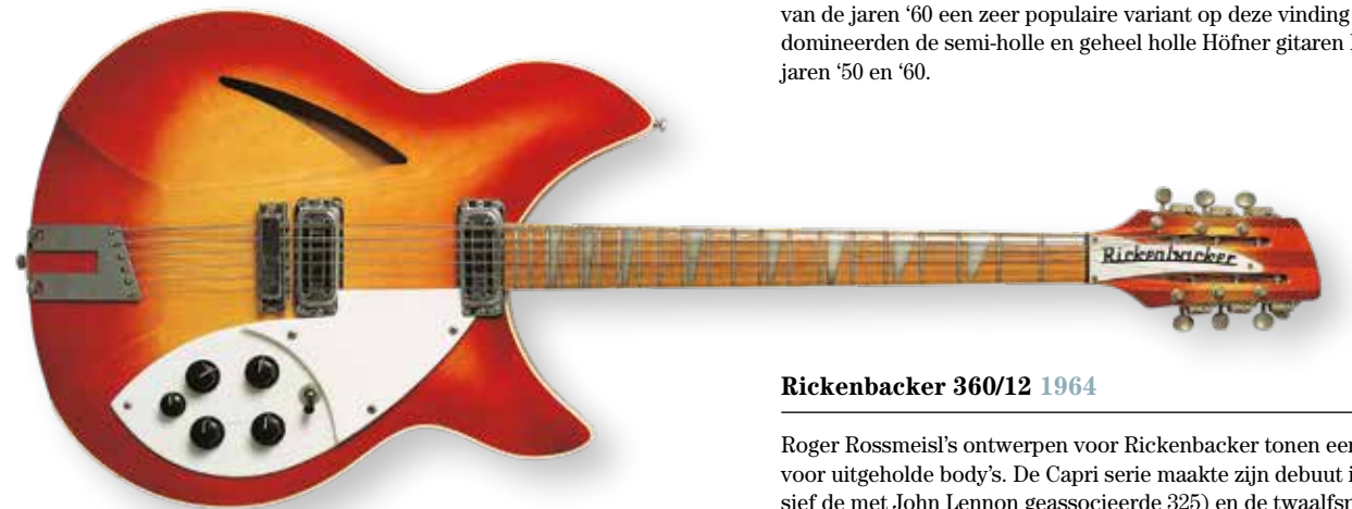
Rickenbacker 360/12 1964

Ook vóór de ES-335 had Gibson al gebruik gemaakt van een ondiepe klankkast. Het cruciale verschil tussen de nieuwe ES-335 met twee positieholtes en zijn voorgangers was dan ook het massieve blok (van esdoorn, ingezaagd sparrenhout en mahonie) dat in het midden van de klankkast werd geplaatst, onder het esdoorn bovenblad. Nu de elementen en de brug in massief hout waren gemonteerd, gedroeg het model zich deels als een massieve gitaar en deels als een holle gitaar. De ES-335 bracht ook de ES-345 en ES-355 voort. Guilds Starfires waren in het Amerika van de jaren '60 een zeer populaire variant op deze vinding en natuurlijk domineerden de semi-holle en geheel holle Höfner gitaren Europa in de jaren '50 en '60.