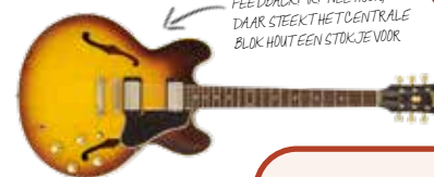
FEEDBACK IK? NEE HOOR, DAAR STEEKT HET CENTRALE BLOK HOUDT EEN STOKJE VOOR