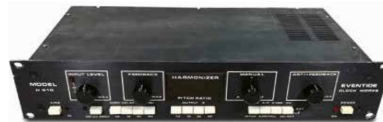
De originele Eventide H910 Harmonizer uit 1974

betreft net een gewone computer. Ik heb de H9000 daarentegen niet tot een vastloper kunnen dwingen; in dat opzicht gaat de vergelijking met een computer gelukkig dus niet op.