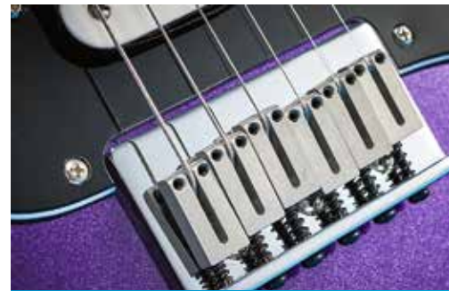
De snaren van de Lead III gaan door de body

Dit is een van de prettigst bespeelbare moderne C-halzen die we afgelopen tijd hebben meegemaakt. De bespeelbaarheid is uitstekend. Er wordt veel gezegd over de vlakke en supersnelle profielen van Ibanez en dergelijke, maar een goed afgestelde Fender C is verslavend! John Mayer denkt dat het geheim van een geweldige gitaar in de soepelheid van de snaren zit en daar zit wat in. Vibrato en opdrukken worden makkelijker als de snaren een beetje meewerken en de elasticiteit van dit model staat ons wel aan. De forse hiel (waar hals en body in elkaar overgaan) doet wat ouderwets aan, maar onversterkt klinkt de gitaar al als een klok; een goed teken. De dunne elzenhouten body's van Fenders met deze mensuur zorgen meestal voor een heldere sound en in combinatie met humbuckers klinken deze gitaren erg levendig. Dat klopt hier helemaal, eens te meer dankzij de alnico II pickups - knapperig, met een mooi randje en voldoende veelzijdigheid. Denk nou niet dat een coilsplit hetzelfde resultaat oplevert als een