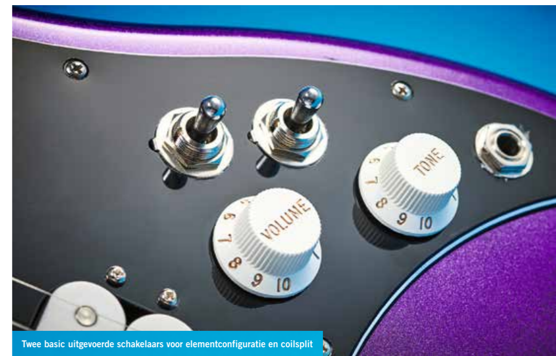
Twee basic uitgevoerde schakelaars voor elementconfiguratie en coilsplit

FENDER LEAD III RICHTPRIJS: € 640,- LAND VAN HERKOMST: Mexico TYPE: elektrische solid-bodygitaar BODY: elzenhout HALS: esdoorn, modern C-profiel TOETS: pau ferro, FRETS: 22 MENSUUR: 648 mm (25,5 inch) HARDWARE: brug met zes blokzadels (snaren door body), vintage jaren-zeventig-stijl stemmechanieken met gestanste F ELEKTRONICA: 2 x alnico II humbucker, volume- en toonregelaar, 3-standen elementschakelaar, coilplitschakelaar (split per element) KLEUREN: Metallic Purple (testexemplaar), Sienna Sunburst, Olympic White DISTRIBUTIE: Fender Musical Instruments EMEA, East Grinstead (VK), tel. 0044 1342 331700 WEBSITE: www.fender.com