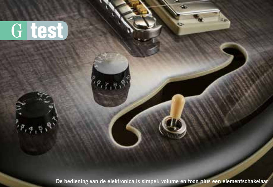
De bediening van de elektronica is simpel: volume en toon plus een elementschakelaar