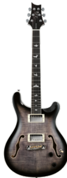
PRS SE HOLLOWBODY II RIGHTPRIJS: € 1160,- (incl. koffer)