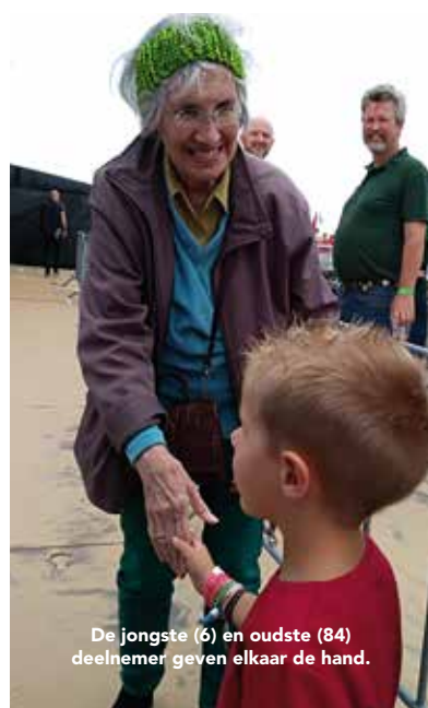
De jongste (6) en oudste (84) deelnemer geven elkaar de hand.