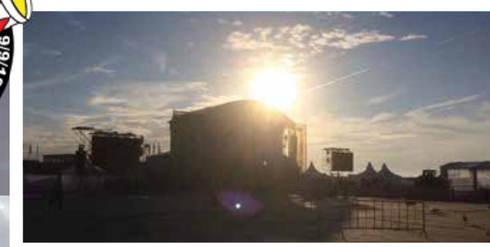
Vanaf 8 uur 's ochtends kwamen de drummers binnen om op te stellen - inclusief Cesar zelf!