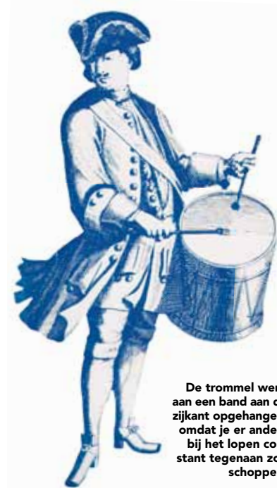
De trommel werd aan een band aan de zijkant opgehangen, omdat je er anders bij het lopen constant tegenaan zou schoppen.

We kunnen er dus vanuit gaan dat mensen al heel lang geleden met trommels gingen lopen. Omdat die trommels vrij diep waren kon je ze niet voor je hangen, je zou er immers constant tegenaan schoppen bij het lopen. De trommel werd daarom aan een band aan de zijkant opgehangen. Aangezien de matched grip in die houding erg lastig is, werd wat we nu de 'traditional grip' noemen gebruikt. Die aanpassing gold natuurlijk alleen voor de linkerhand, want de rechter kon in de normale houding slaan.