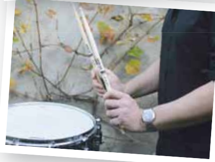
Een ongewenste polsstand bij harde slagen met de Franse grip (boven) en de Duitse grip (onder)

>> Daardoor moest je wel een van de bovenstaande bewegingen gebruiken. Zo voorkwam de leraar dat de pols in een ongezonde hoek werd bewogen.