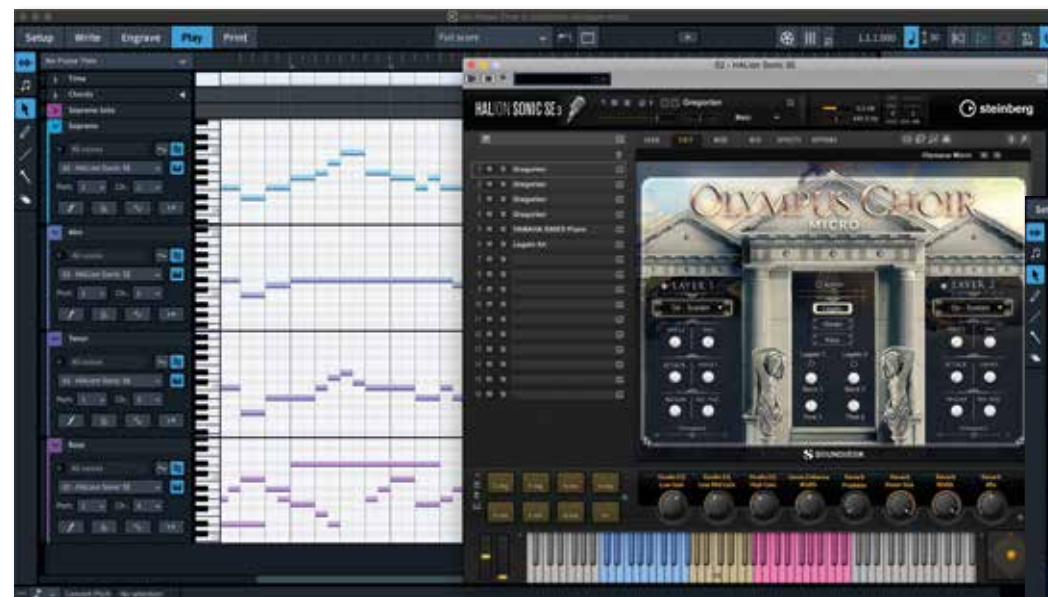
HALion SE bevat veel interessante soundmogelijkheden.