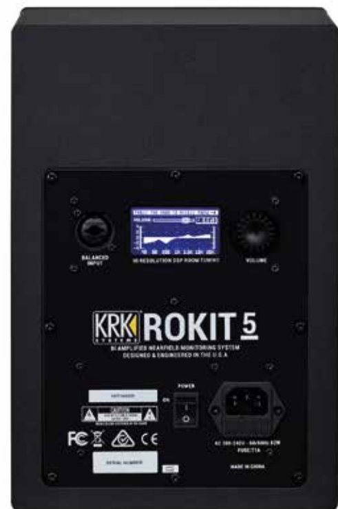
Op de achterkant zie je een curve met je EQ-instellingen. Luxe!

Respons Nieuw in deze vierde generatie is de dsp, waarmee je de respons van de speakers kunt aanpassen aan de luisterruimte. Deze voorziet de RP's van een instelbare EQ. De instellingen van de EQ worden grafisch in een curve weergegeven; best luxe voor een speaker in deze prijsklasse. Helemaal vrij instelbaar is de EQ niet, want je hebt voor het hoog en het laag te maken met heel specifieke instellingen. Voor het laag zijn er instellingen met shelving bij 60 Hz en parametrisch bij 200 Hz, en combinaties daarvan. Voor het hoog is dat shelving bij 10 kHz en parametrisch bij 3,5 kHz, en ook weer in combinaties. De maximale waarden zijn +/- 2 dB. Die waarden en combinaties zitten ingesloten in presets. Dat lijkt een beperking, maar KRK heeft daar een specifieke bedoeling mee.