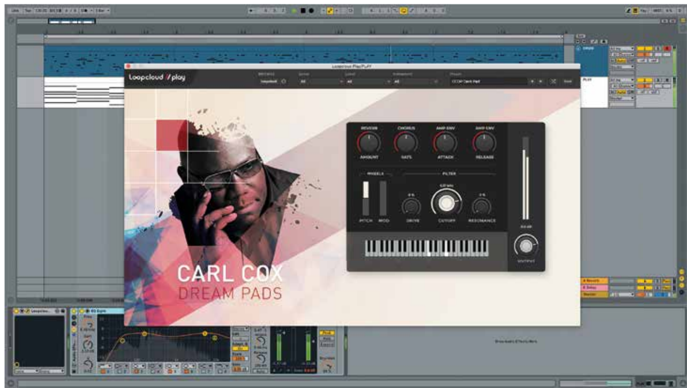
Loopcloud Play Ableton

soort van je productie worden alle tonale loops automatisch getransponeerd. Zo voeg je in een handomdraai een baslijntje of synthesizerpartij toe. Erg praktisch verder is de pattern-functie. Alle samples kunnen namelijk in stukken geknipt worden – de zogenoemde 'regions' – die je individueel kunt bewerken. Met pitch, duplicate, drag, volume, fade-in, fade-out, reverse, et cetera kunnen zo complexe patronen gecreëerd worden die je ook kunt opslaan voor gebruik