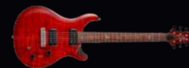
PRS SE PAUL'S GUITAR

De huidige Amerikaanse modellen veranderen constant. Veel gitaarfabrikanten proberen wanhopig vast te houden aan de magie van hun eerste klassieke ontwerpen, maar PRS heeft zich daar nooit mee beziggehouden. De wil om steeds betere instrumenten te maken en