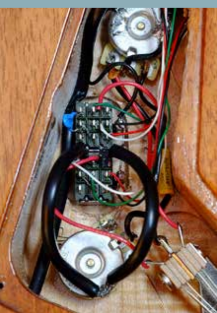
Elektronica van het Amerikaanse model